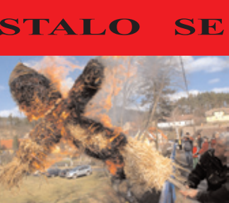
Tradičním Vynášením smrtky byla vyhnána zima a přivítáno jaro.