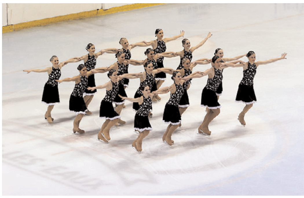
Blahopřejeme příbramskému juniorskému týmu synchronizovaného bruslení DAISIES k úspěchu.