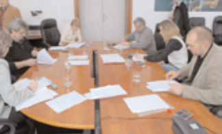
Město Příbram a několik okolních obcí uzavřely Svazek obcí Čistá Litavka. Město chce na realizaci projektu Čistá Litavka získat peníze ze strukturálních fondů EU.