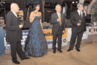
V březnu uspořádala OHK Příbram tradiční Ples podnikatelů. Vítězek byl věnován Dětskému domovu v Dubenci, za což patří OHK velký dík.