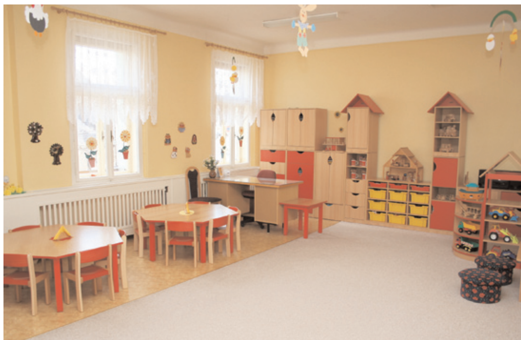
Děti z Mateřské školy pod Svatou Horou se radují z nového nábytku, který byl pořízen z rozpočtu města.