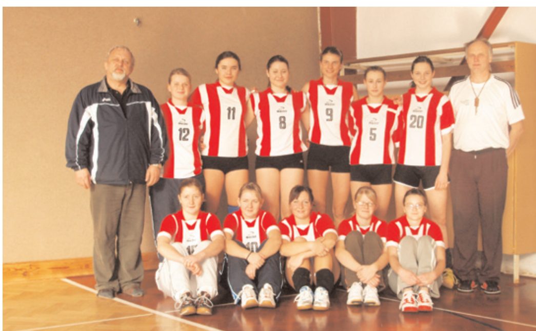
Úspěšné volejbalistky ze Základní školy pod Svatou Horou, Příbram. Hrají pod hlavičkou TJ Baník a přivezly do Příbrami Český pohár. Srdečně blahopřejeme!