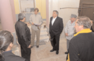
Před nastěhování Městské policie do nových prostor v budově bývalého ředitelství Rudných dolů si celý objekt důkladně prohlédli členové Rady města Příbram.

Vážení spoluobčané, dovoluji si Vás informovat o změně sídla Městské policie Příbram. Od 1. 4. 2008 sídlí Městská policie Příbram na nové adrese: náměstí T. G. Masaryka 121, Příbram I. Telefonní čísla zůstávají stejná (bezplatná tísňová linka 156 nebo 318 624 245).