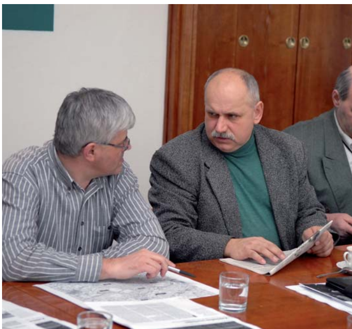
Starostové z obcí a měst, které sousedí s VÚ Brdy, jednali na příbramské radnici. Tématem bylo umístění americké radarové základny na území Brd a chystané zpřístupnění části vojenského prostoru pro veřejnost. Starostové vyzvali premiéra vlády, aby je podrobně informoval o chystané stavbě radaru. Premiér Mirek Topolánek dosud na dopis podepsaný šestnácti starosty nereagoval.