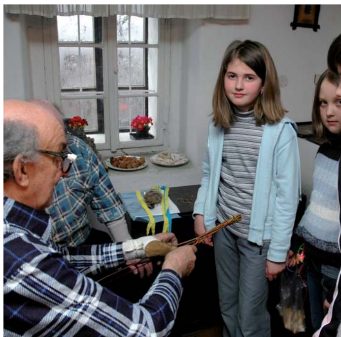
Pracovníci Hornického muzea uspořádali i letos tradiční Hornické Velikonoces. Program v hornické chalupě navštěvuje i řada školních zájezdů z celé České republiky.