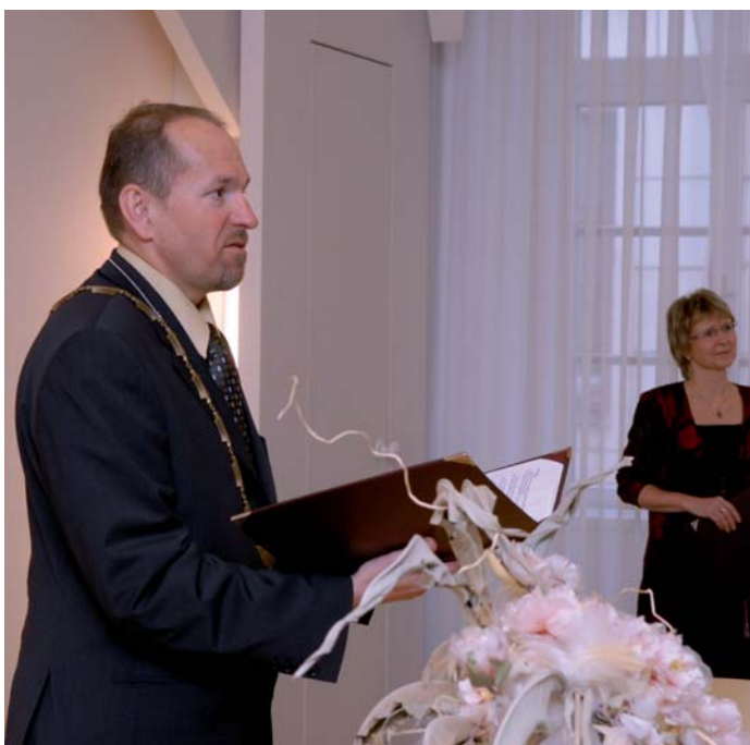
Po necelém půlroce se letos v březnu opět ujal funkce oddávajícího bývalý starosta města, nyní náměstek ministra financí a člen příbramského zastupitelstva Ing. Ivan Fuksa.