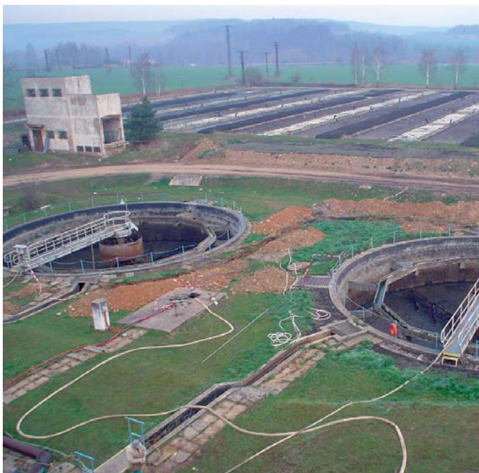
Další kontrolní den na čistírně odpadních vod proběhl dne 28. 3. Kromě zástupců města zde byli přítomni také zástupci dodavatele a projednával se aktuální stav této stavby.