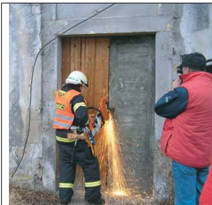
Dobrovolní hasiči z SDH Příbram I si stále zvyšují svoji odbornost, a to i účastí na různých odborných akcích.