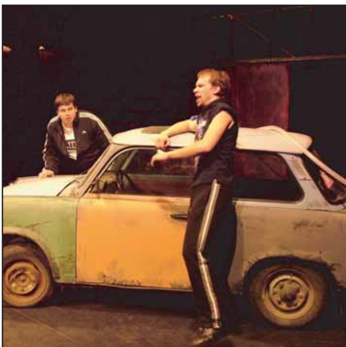
Muzikál „Donaha“ v nastudování příbramského divadla má obrovský úspěch a zatím byla všechna představení vyprodána.