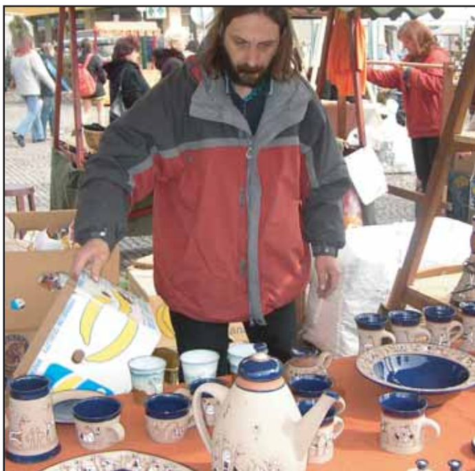
Jarní trh na náměstí T. G. Masaryka skutečně navodil jarní pohodu. Byla zde k dostání keramika všeho druhu, výrobky ze dřeva, kovu, skla, pomlázky, kraslice, jarní kytičky a různé pekařské dobroty.