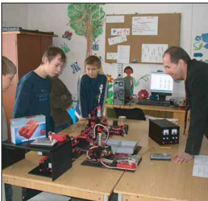
V Q-klubu byli vyhodnoceni ti nejlepší v mládežnické soutěži technických projektů QUIDEX 2006.