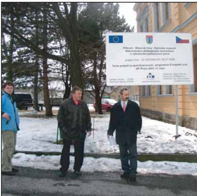
Dne 27. března byla slavnostně zahájena rekonstrukce náměstí Hynka Kličky na Březových Horách. Město na tuto akci obdrželo dotaci z Evropské unie.