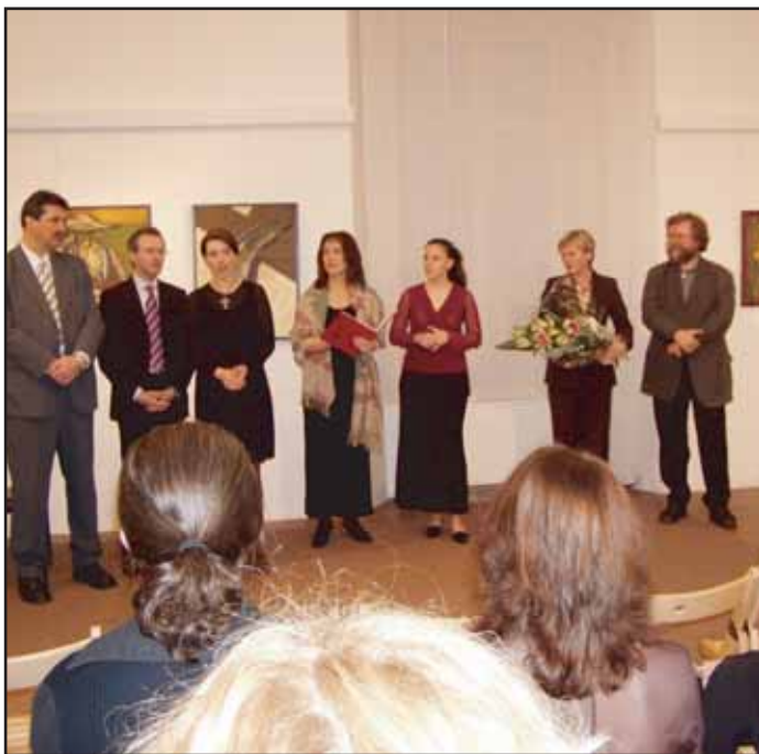
V Galerii F. Drtíkova v Zámečku - Ernestinu byla v rámci festivalu Slovanské jaro výstava ruského malířství a užitého umění. Součástí vernisáže byl koncert ruské komorní hudby.