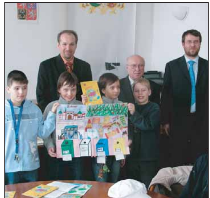
Vítězové dětské soutěže, kterou organizovala firma Veolia voda (4.B z 1. základní školy Příbram), byli slavnostně přijati na radnici.