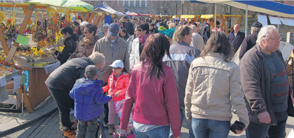
Farmářské trhy navštěvují pravidleně stovky lidí.

Pořádáním Farmářských trhů chce město pomoci farmářům s propagací a prodejem jejich výrobků, zvýšit zájem občanů o české zemědělské produkty, rozšířit nákupní možnosti a sortiment a tím podpořit zdravý životní styl Příbramanů.