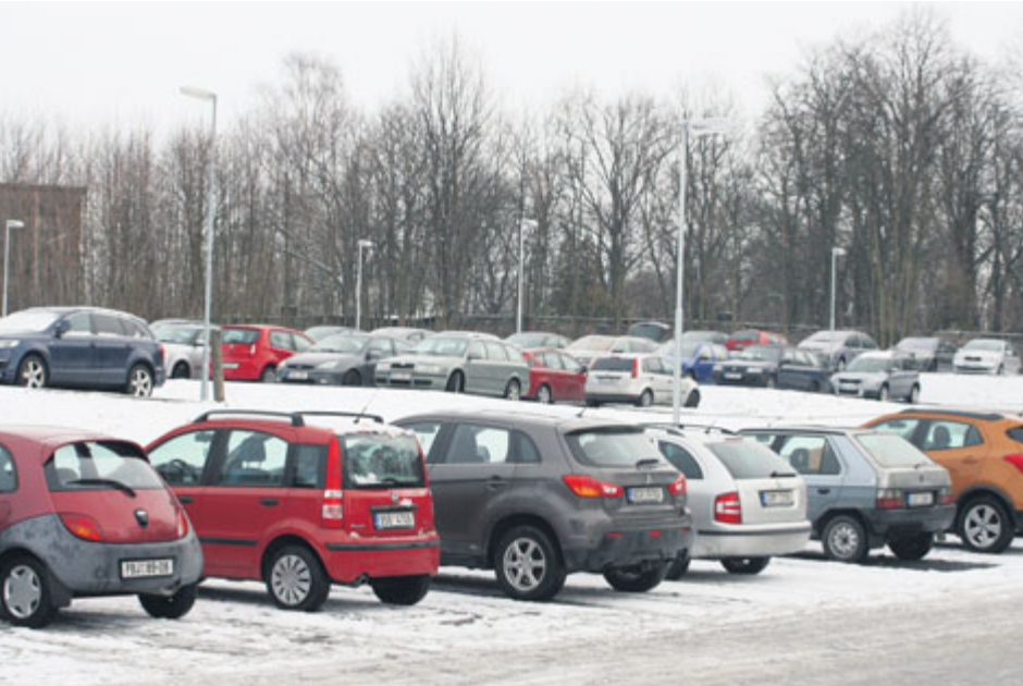
Nyní parkoviště funguje ve zkušebním provozu.

Nové parkoviště u nemocnice bylo otevřeno pro motoristickou veřejnost. V současnosti funguje ve zkušebním provozu a parkování je zde zdarma.