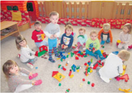
Do dětských skupin mohou rodiče vodit už jednorocní děti.

O děti pečují tým odborníků, mezi něž patří zdravotní sestry, fyzioterapeut, speciální pedagog, sociální pracovník, chůva pro děti do zahájení povinné školní docházky. Pečující osoby - vychovatelky, které pracují s dětmi v dětských skupinách, musí splňovat všechny zákonné kvalifikační předpoklady. Podmínkou je mimo jiné znalost vývojové psychologie, pedagogiky, didaktiky a první pomoci.