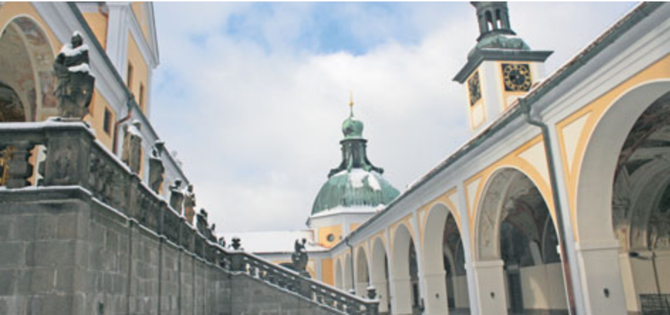
Svatohorský poutní areál.