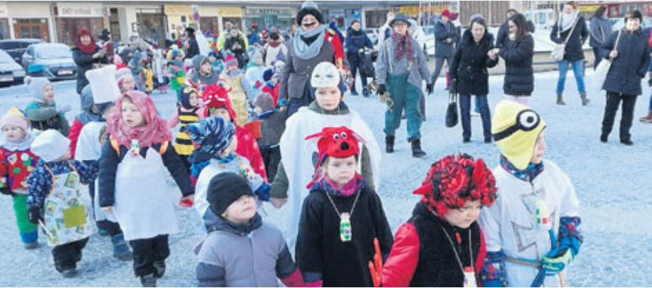
Dětský masopustní průvod dorazil také na příbramské sídliště.

Dlouhou tradici má masopust na Březových Horách, na kterém spolupracují i bohatnější hasiči. Děti z mateřinek se letos účastnily veselí na náměstí 17. listopadu.