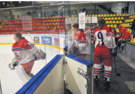
Zimní stadion by měl sloužit prioritně sportu.

Zastupitelé rozhodli, že prodejna nábytku do prostor zimního stadionu nepatří. Pronájmy tohoto typu podle části zastupitelů neodpovídají nové koncepci Sportovního zařízení města Příbram.