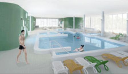
Rekonstrukce by měla zatrávňovat aquapark pro příbramskou veřejnost i návštěvníky města.

složení zastupitelstva města vzešlé z podzemních komunálních voleb,“ uvedl starosta s tím, že podle jeho názoru se jedná o velký závazek, který by na sebe se vši zodpovědností mělo nové zastupitelstvo převzít. „Nebylo by seriózní, aby stávající zastupitelstvo měsíc před skončením svého mandátu tak závažné rozhodnutí učinilo,“ dodal.