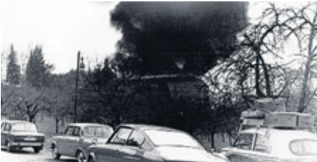
S plameny na Svaté Hoře zápasili hasiči několik dní.