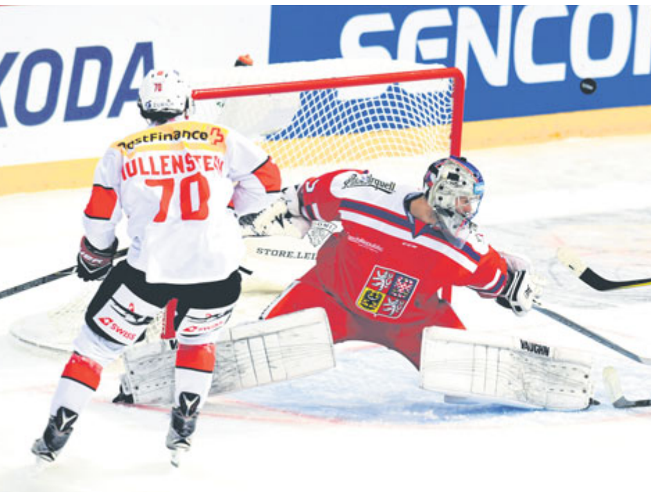
Po mnoha letech se do Příbrami opět vrací hokejová reprezentace.

Ve dnech 4. a 5. dubna se na příbramském zimním stadionu uskuteční dvě utkání mezi českým a švýcarským reprezentačním výběrem. Tato akce je příležitostí pro všechny hokejové fandby, zároveň však ovlivní dopravu a parkování v blízkosti stadionu.