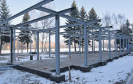
Ocelový skelet nové restaurace.

Práce na revitalizaci Nového rybníku pokračují i přes zimu. Jen před pár týdny vyrostla v prostoru původního stánku s občerstvením ocelová konstrukce, která tvoří základ budoucí nové restaurace.