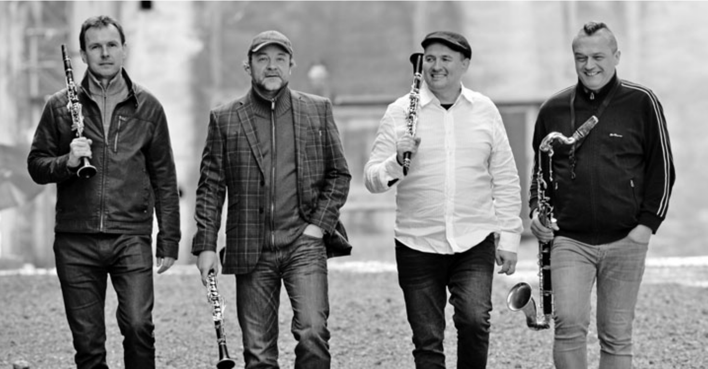
Clarinet Factory vystoupí v prostorách březnické Galerie Ludvíka Kuby.

Slavíme padesátku, tak letošním tématem festivalu nemůže být nic jiného než jubileum. Budeme slavit. A to s hvězdami, které u nás už v minulosti vystupovaly. Podařilo se nám oslovit umělce, kteří zanechali v příbramském, a nejen v příbramském publiku hluboký dojem. Zopakujeme si proto vystoupení z roku 1969, kdy jediným velkým souborem, který vystoupil na prvním ročníku HFAD, byl právě Symfonický orchestr Československého rozhlasu. Tehdy na závěrečném koncertu odehráli Dvořákovu 8. a 9. symfonii. My tento koncert letos připomeneme při slavnostním zahájení uvedením 8. symfonie, přičemž v první polovině večera necháme zaznít nádherné operní árie a dueta v podání předních slovenských pěvců, hostů významných světových operních scén. Jejich výběr není