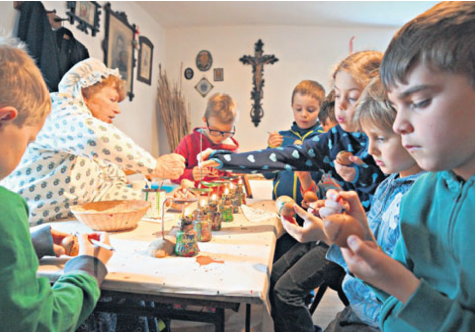
Velikonoce v hornickém domku jsou příležitostí poznat velikonoční tradice.

V Hornickém muzeu Příbram si od 19. března do 1. dubna návštěvníci připomenou, jak Velikonoce, nejvýznamnější křesťanské svátky, oslavovali březohorští havíři na přelomu 19. a 20. století.