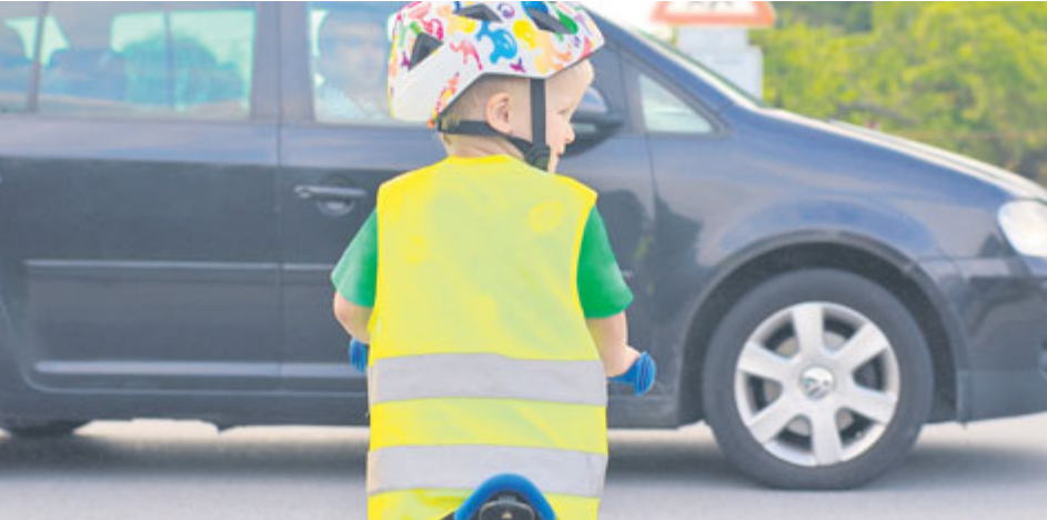
Reflexní prvky na oděvu mohou zachránit život.

Modré oblečení je vidět jenom na 18 metrů. Pokud má chodec na sobě oblečení s reflexními prvky, jeho viditelnost se podstatně zlepšuje. Podle testů se může zvýšit až desetinásobně.