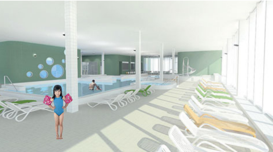
Aquapark bude mít nové atrakce, které ocení zejména děti.

Příbramští zastupitelé učinili další krok v přípravě rekonstrukce aquaparku. Na svém posledním zasedání vzali na vědomí zvýšený rozpočet rekonstrukce a rozhodli také o rozsahu zpracování prováděcí dokumentace.