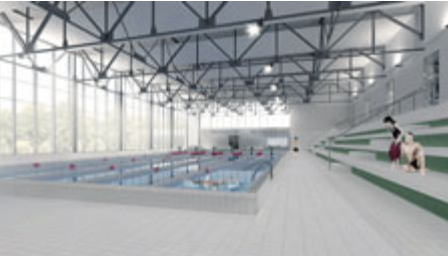
Takto by po rekonstrukci měl vypadat plavecký bazén.