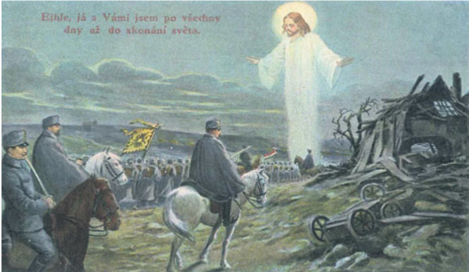
Politicky závažná pohlednice, zabavená státními úřady v roce 1916.

Hned v prvním čísle regionálního listu Horymír 1916 vyšel článek příbramského kaplana Antonína hraběte Bořka Dohalského, kterého italští vystěhovalci (jakmile se tu usadili, už se jim oficiálně neříkalo uprchlíci) neznající řeč ani zdejší poměry požádali coby svého největšího pomocníka o veřejné poděkování všem za vánoční nadílku pro italské děti.