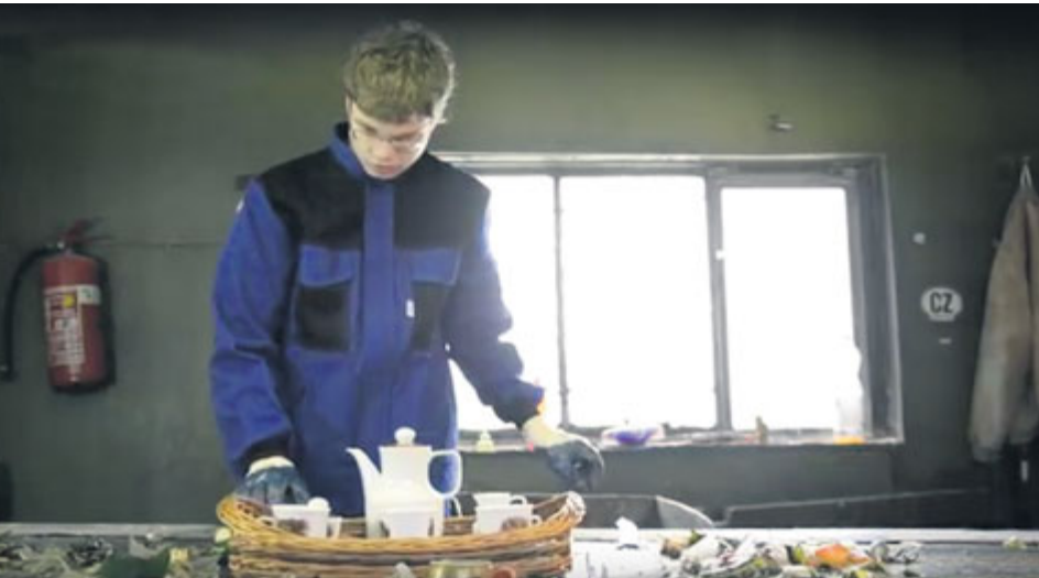
Které věci do skla nepatří?

Seriál O odpadu vtipně příbramské studentské televize GymTV pokračuje dalším dílem. První se týkal třídění papíru s akcentem na povánoční úklid, tentokrát je na programu sklo. Co do bílých a zelených kontejnerů na sklo nepatří, se dozvíte v novém videoklipu.