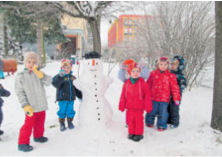
Stavění sněhuláka na zahradě baví každého.

Dětské skupiny a rehabilitační stacionář Příbram jsou jedním ze středisek Centra sociálních a zdravotních služeb města Příbram. Dětské skupiny Berušky a Sluníčka byly registrovány již v roce 2016 a poskytují péči a služby dětem ve věku od roku do pěti let. Do rehabilitačního stacionáře docházejí i děti s různými specifickými potřebami a handicapem, a to ve věku 1–7 let.