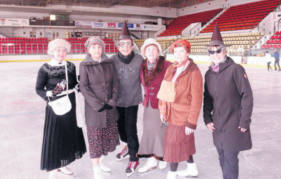
Veřejné bruslení je zábava pro všechny věkové skupiny.

Sportovní zařízení města Příbram chystá ukončení sezony na zimním stadionu. Při té příležitosti jsou rozšířeny časy posledního veřejného bruslení.