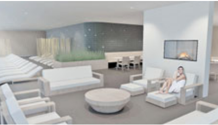
Jedním z lákadel bude bezpochyby saunový svět.

O definitivní podobě realizace stavby a způsobu financování budou muset zastupitelé ještě rozhodnout. „Osobně jsem toho názoru, že o rozhodnutí, zda provést rekonstrukci aquaparku, a to včetně jeho rozšíření o zážitkovou zónu a saunový svět, by mělo hlasovat již nové