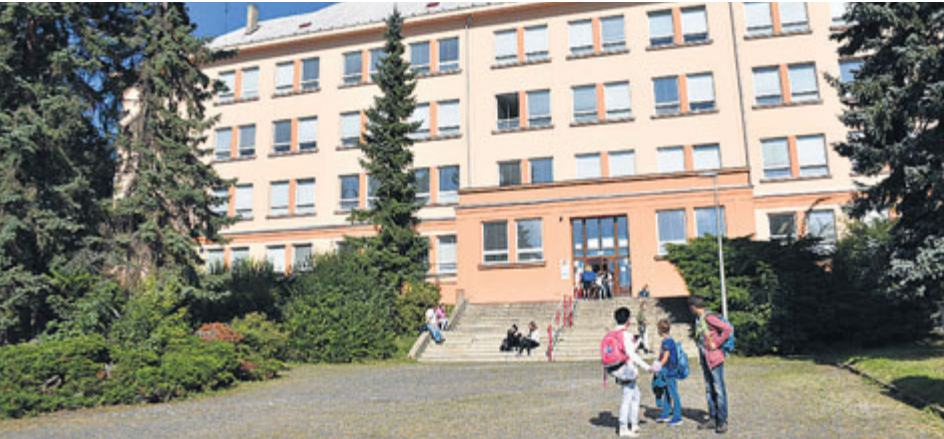
Školy by měli vést ti nejlepší z nejlepších, říkají radní.

V roce 2018 končí šestileté funkční období celkem 17 ředitelů škol a školských zařízení zřizovaných městem Příbram. Radnice se po projednání rozhodla vyhlásit konkurzy na místa všech ředitelů základní škol, kterým toto období letos končí. Rozhodnutí města se konkrétně týká pěti ze sedmi základních škol.