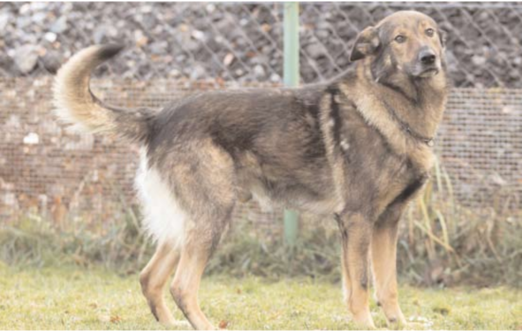
Bandita, ev. č. 237: Asi čtyřletý německý ovčák, výborný hlídač, poslušný, odchycen dne 27. 11. 2013 ve Školní ulici. Tento pes potřebuje dostatek pohybu, proto by jistě nepohrdl velkou zahradou.