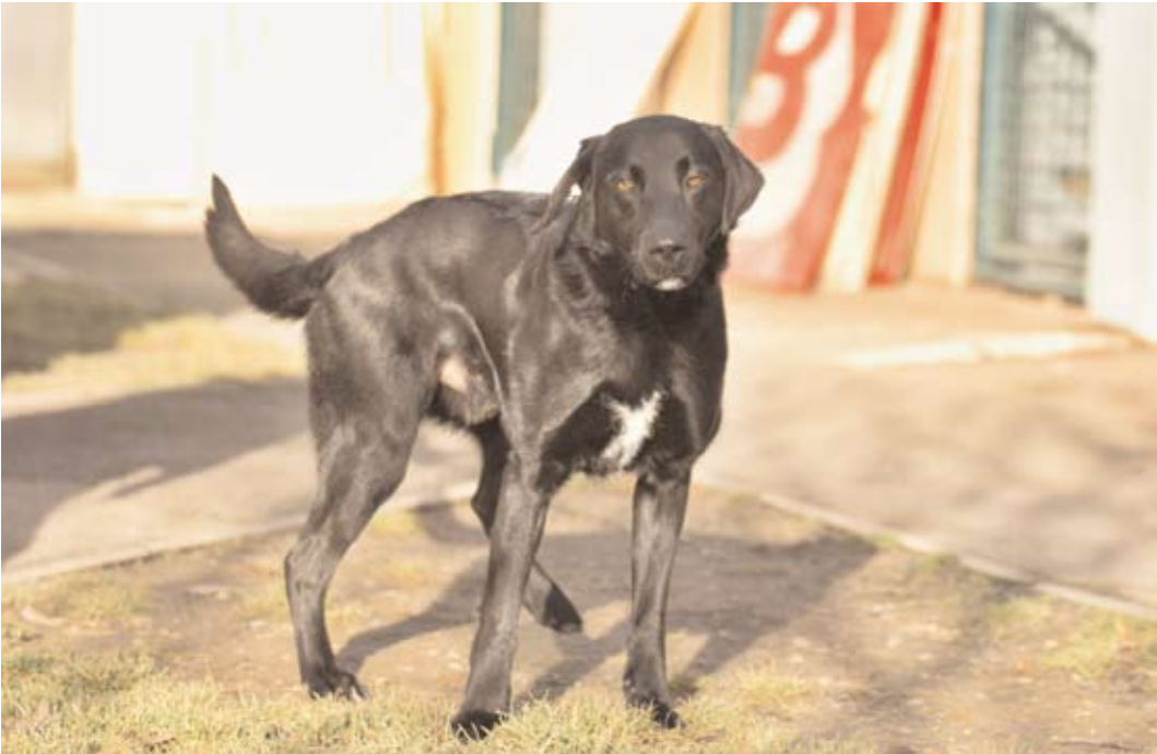
Čaky, ev. č. 27: Kříženec labradora a NO, asi 1,5letý pes. Odchycen 6. 1. 2014 u Fialky. Je hodný, vhodný k hlídání domku s velkou zahradou.