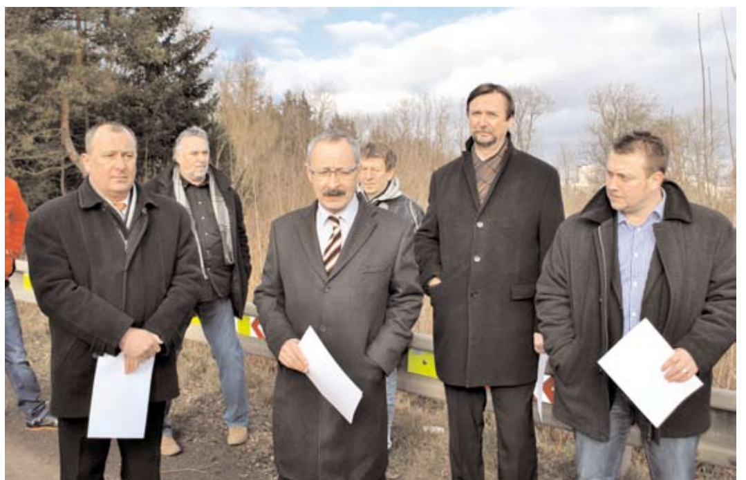
Město převzalo pomocné dopravní značení na silnici Příbram - Brod. Akce se zúčastnili zástupci města, Městské policie Příbram, Hasičského záchranného sboru a realizující firmy.