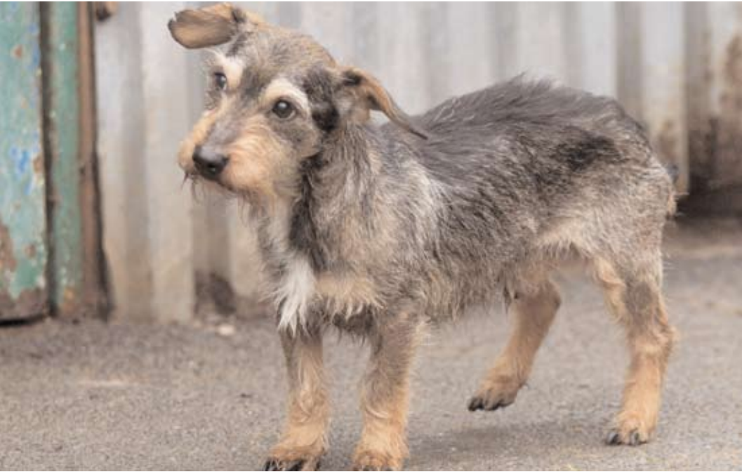
Beník, ev. č. 38: Kříženec hrubosrstého jezevčíka asi 8letý, velice hodný, vhodný ke starším lidem, kterým bude skvělým společníkem.