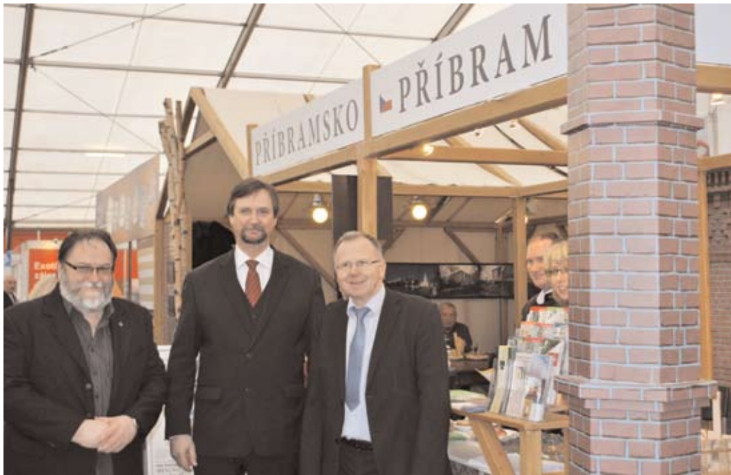
Starosta Ing. Pavel Pikrt navštívil stánek města Příbram na Holiday World 2014 v Praze.