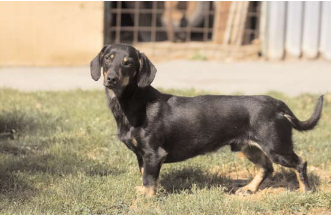
Pišta, ev. č. 11: Je svérázný asi 2letý jezevčík. Je vhodný k domku se zahradou, který skvěle ohlídá. Pišta nemá rád jistá omezení, proto není vhodný k dětem. Více informací u nás v útulku.