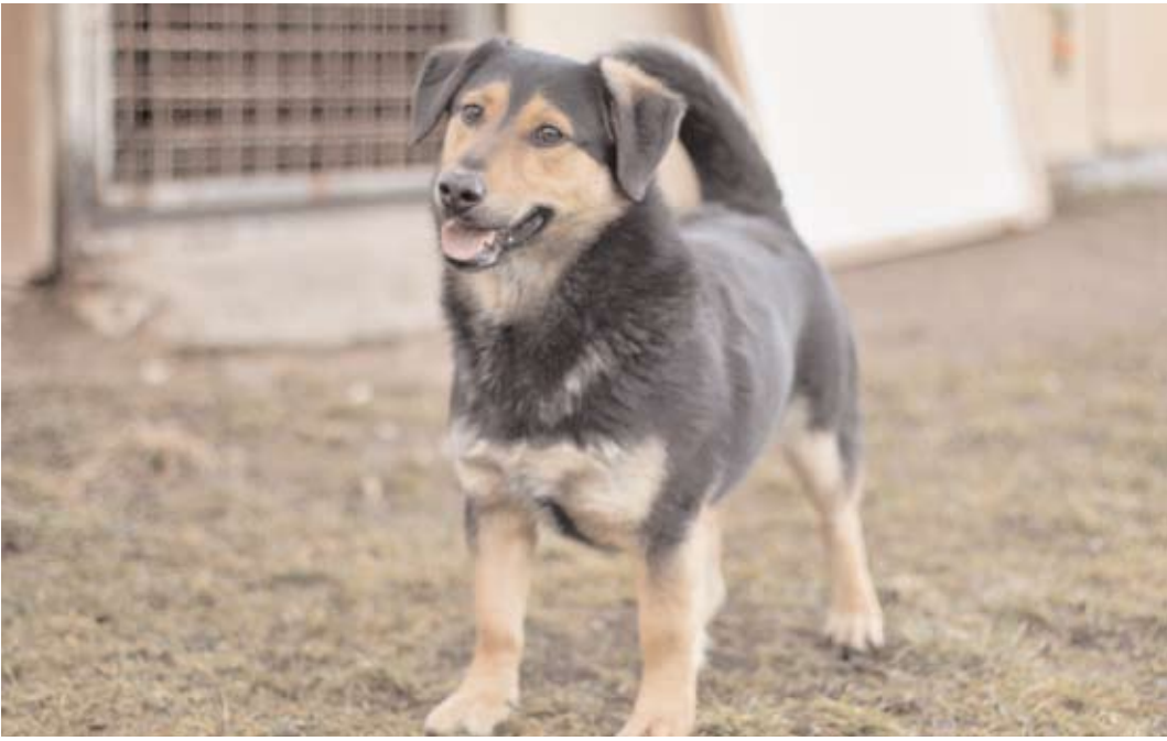
Kazan, ev. č. 48: 2-3letý kříženec, přátelský, čistotný, může být i v bytě. Nemá rád kočičky a drobná domácí zvířata. Odchycen MP dne 4. 11. 2013 v Jiráskových sadech.