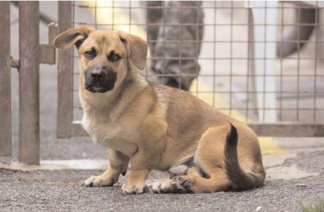
Tramp, ev. č. 10: 1,5roční kříženec basseta a NO. Vinou nesmyslného krytí je malinko handicapovaný, proto je vhodný pro starší, méně pohyblivé lidi. Čistotný, se srdečným úsměvem, který každého potěší.