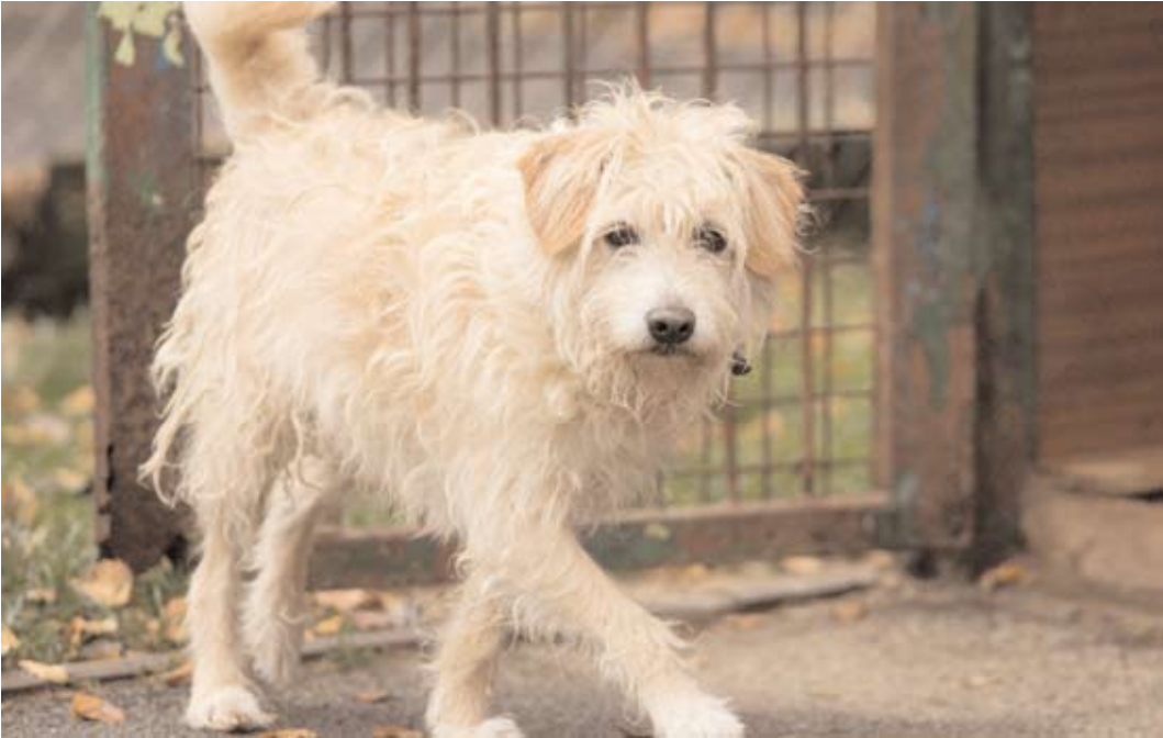
Fido, ev. č. 12: Čtyřletý kříženec, který by rád hlídal vaši zahradu. Není vhodný k dětem. V útulku je již od 29. 10. 2013.