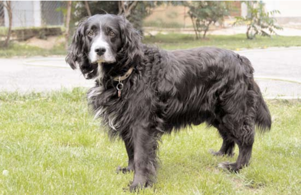
Oskar, ev. č. 15: Je to 8-9letý kříženec kokršpaněla, čistotný, vhodný pouze do bytu. Má rád děti. Umřela mu panička a on stále čeká na nějakého nového pána, kterému by zpříjemnil třeba i stáří. Není vhodný k ostatním psům.