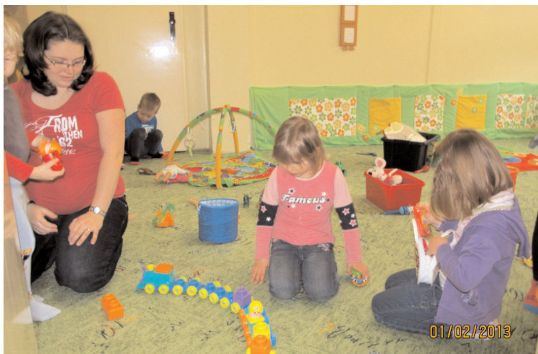
V Příbrami vzniklo nové Mateřské centrum Jablíčko. Je umístěno v prostorách bývalé II. polikliniky v ulici Legionářů v Příbrami VII.