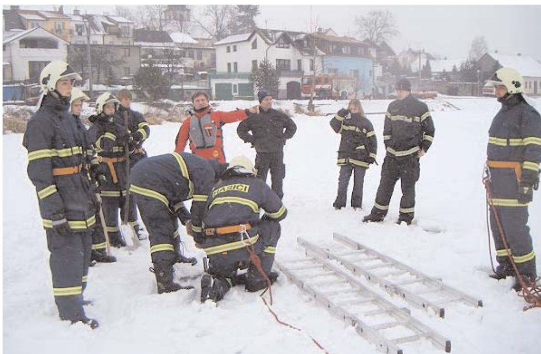
Příbramští dobrovolní hasiči učili své kolegy z Písku zachraňovat člověka, pod kterým se prolomil led. Tato spolupráce je velmi užitečná pro obě strany a přispívá ke zvýšení dovedností.