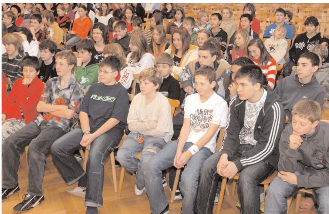
Další beseda na téma "Prevence kriminality" se uskutečnila na Základní škole Jiráskovy sady.