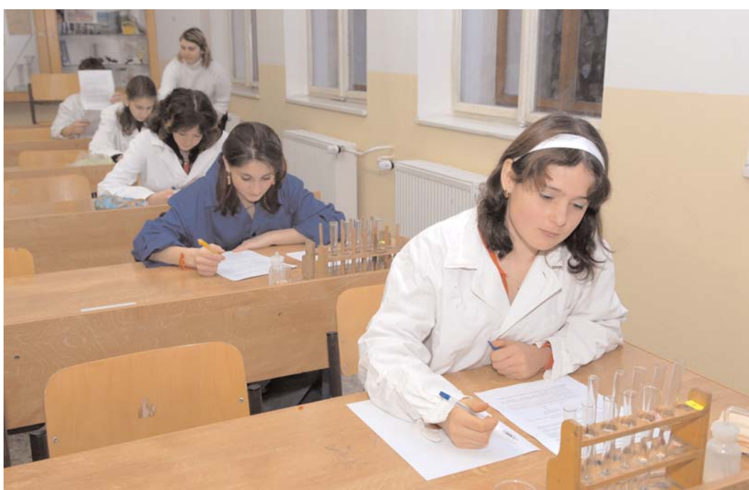
V těchto dnech se konají v základních školách různé olympiády. Na snímku jsou účastníci chemické olympiády starších žáků, která proběhla na Základní škole Jiráskovy sady.