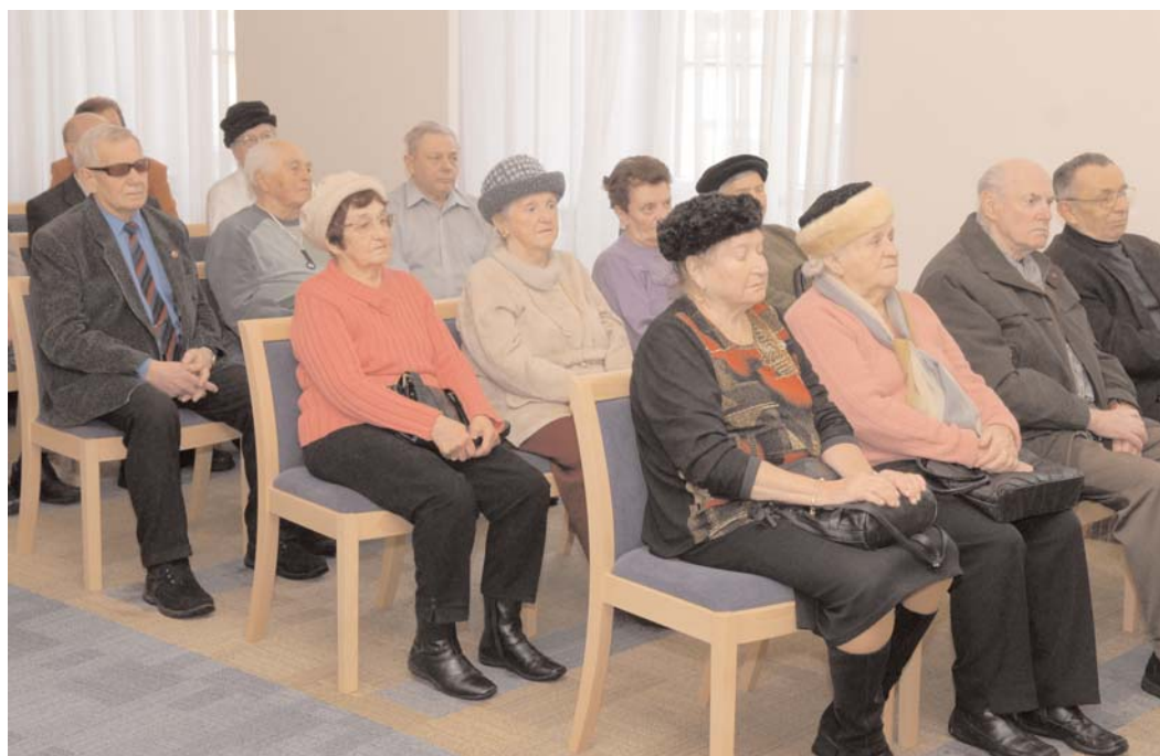
Dne 19. 2. jsme si připomněli smutné výročí popravy 16 příbramských občanů v Německu.