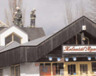
O minulém víkendu se také našim městem přehnala bouře a vichřice. Na Rynečku spadl topol, a to přímo na zaparkované auto a na koloniál Ryneček. S odklizením pomáhali dobrovolní hasiči.