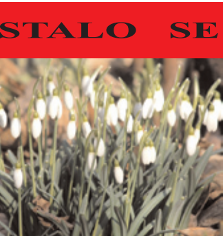
V únoru se na zahrádkách objevily první sněženky a to je znamení, že zima už nebude dlouho trvat.