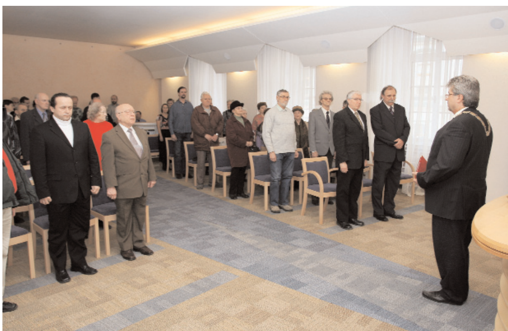
Slavnostním pietním aktem si město připomnělo 16 příbramských občanů, kteří byli popraveni v únoru 1945 v německém Brandenburgu.