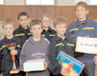
V sobotu 1. 3. závodili mladí hasiči o pohár starosty města Příbram. V kategorii mladších žáků vyhrálo družstvo z Příbrami.