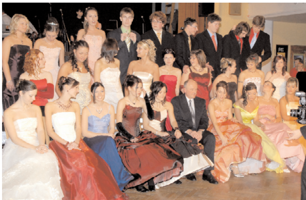
Snímek studentů jedné třídy Obchodní akademie a VOŠ Příbram si připomínáme, že právě nyní probíhají slavnostní maturitní plesy středních škol.