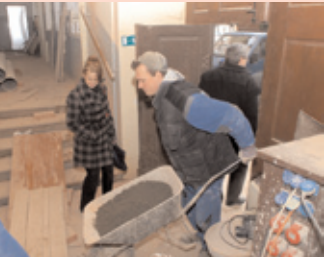
V budově bývalého ředitelství Rudných dolů na náměstí T. G. Masaryka je čilý stavební ruch. Do části budovy se nastěhuje Městská policie Příbram.