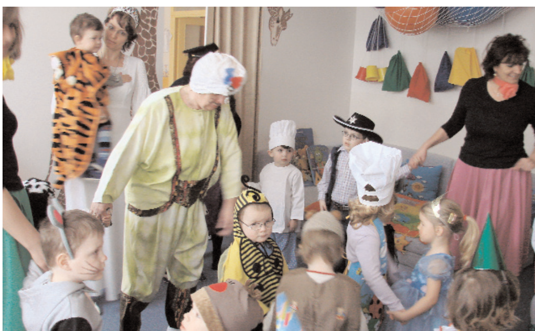
Ani v městských jeslích a rehabilitačním stacionáři si nenechali ujít masopustní veselí.