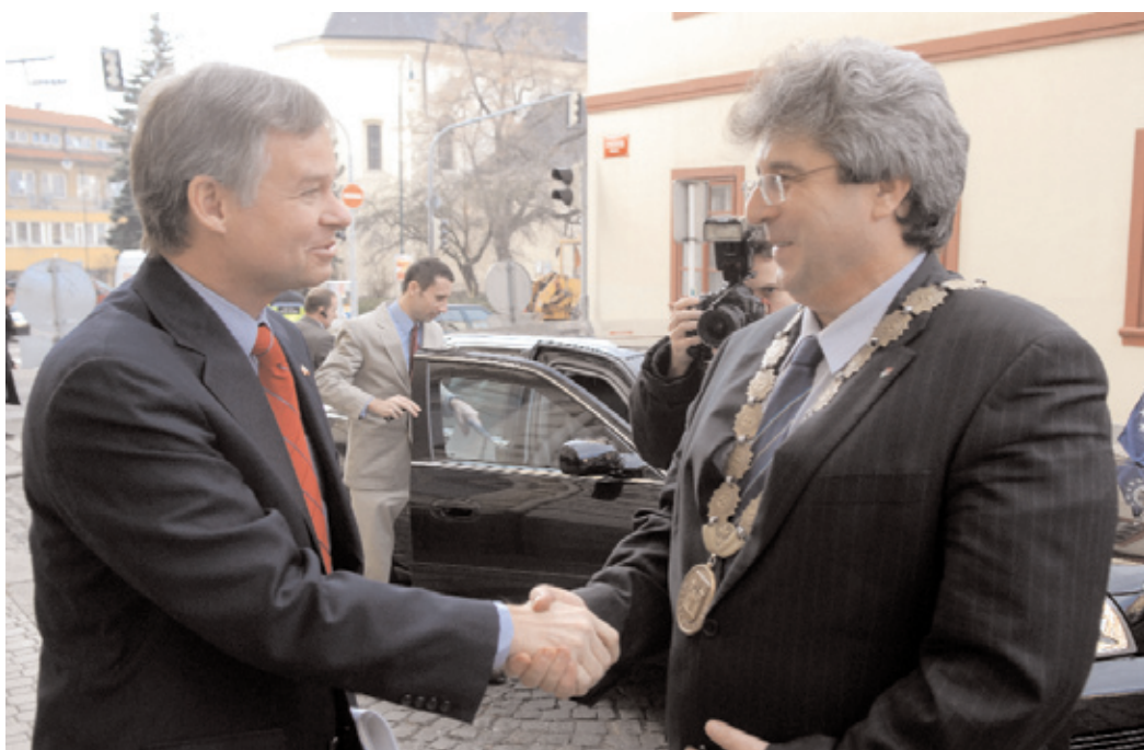
Starosta J. Řihák pozval na návštěvu Příbrami velvyslance USA v ČR R. W. Grabera.