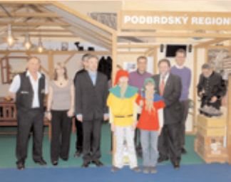
Město Příbram se zúčastnilo veletrhu Holiday World 2008 v Praze.