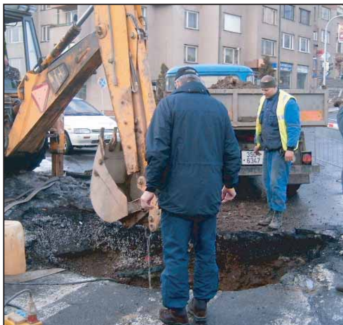
Práce na odstranění poruchy byly opravdu velice intenzivní.