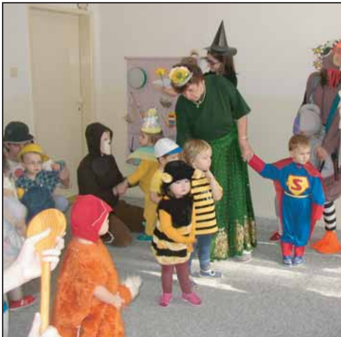
V úterý 28. 2. propuklo masopustní veselí také v městských jeslích. Děťákům to opravdu moc slušelo.