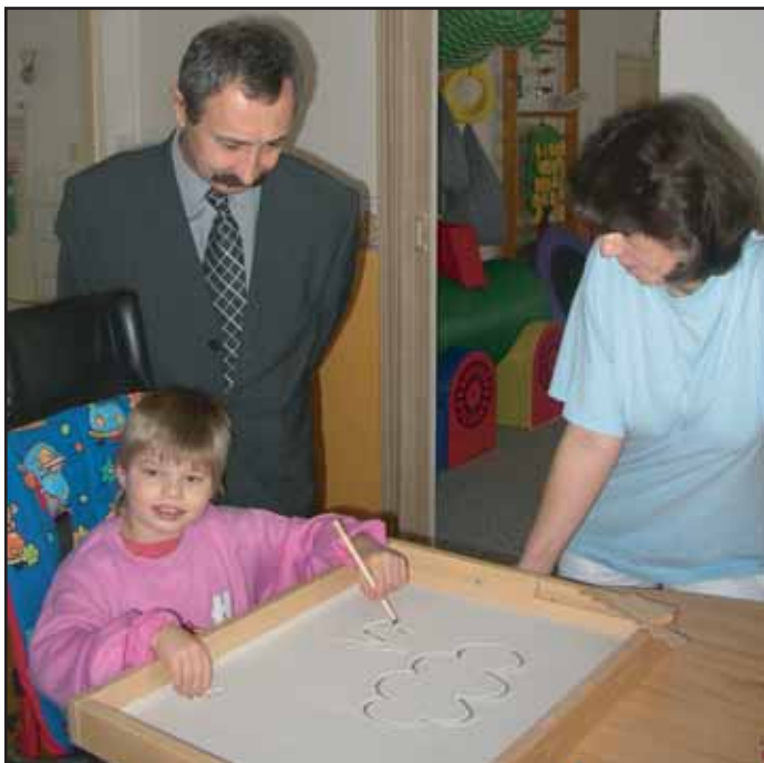
Aby se novináři mohli na vlastní oči přesvědčit o jedinečnosti městských jeslí, byla svolána tisková konference právě sem. V závěru všichni ocenili poctivou a vysoce odbornou práci celého kolektivu.