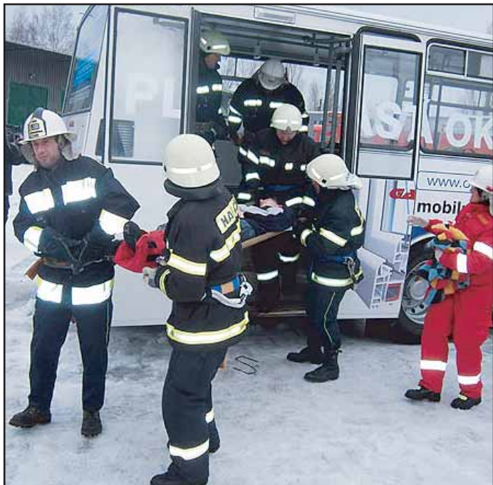
Dobrovolní hasiči z Jednotky SDH Příbram I., Trhových Dušníků, strážníci Městské policie Příbram a členové Červeného kříže měli cvičení. Téma: havárie autobusu plného dětí. Simulovanou situaci všichni dobře zvládli.