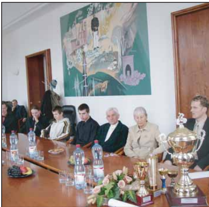
Úspěšní příbramští cyklisté, kteří v loňském roce získali řadu medailí, byli přijati na radnici.