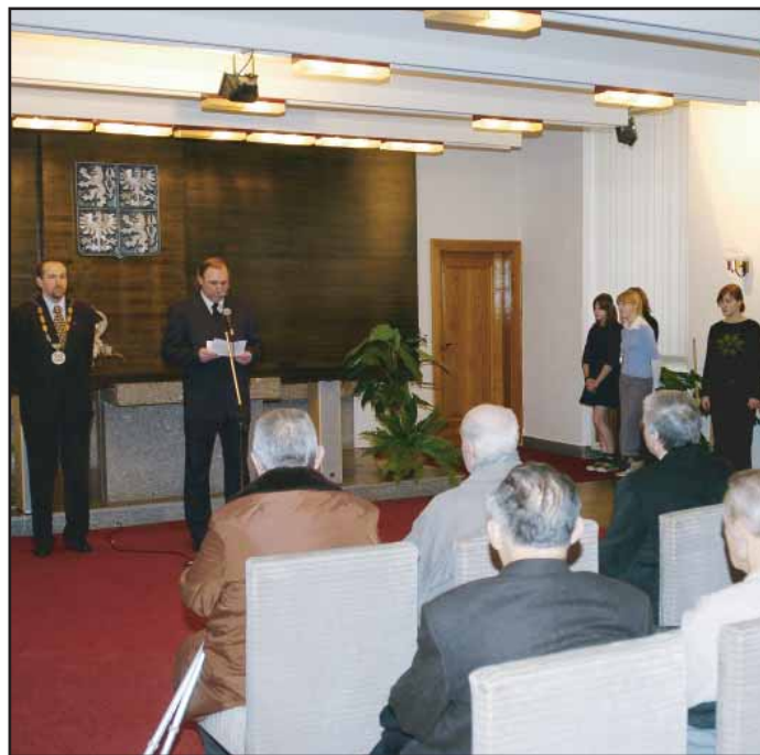
Ve čtvrtek 16. 2. jsme si připomněli výročí poprav 16 příbramských občanů v německém Neubrandenburgu.