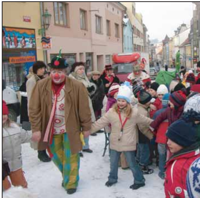
V úterý 28. 2. zavítal masopustní rej do Příbrami. Ráno před osmou hodinou přivítali žáci příbramských škol masopustní průvod hasičů z Bohutína.