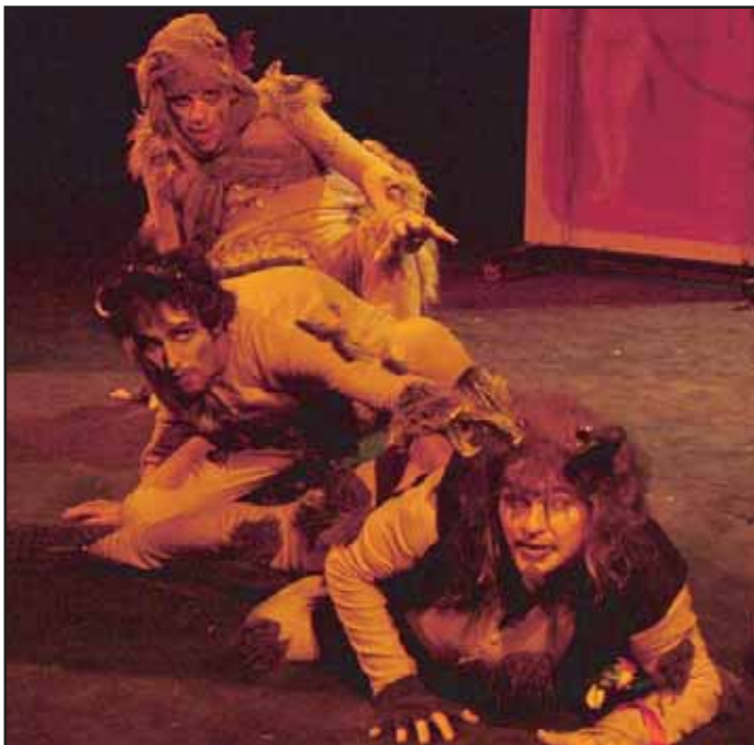
Ve čtvrtek 24. 2. mělo Divadlo Příbram další premiéru. Tentokrát příbramští nastudovali Hrátky s čertem od Jana Drdy.