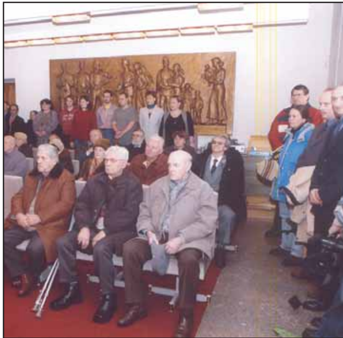
Také letos jsme si připomněli den, kdy fašisté popravili v Neubrandenburgu šestnáct příbramských občanů.