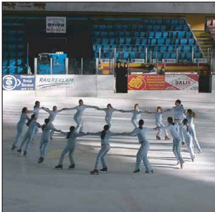
Členky Bruslařského klubu Příbram se zúčastnily Mistrovství ČR v synchronizovaném bruslení v Jihlavě.