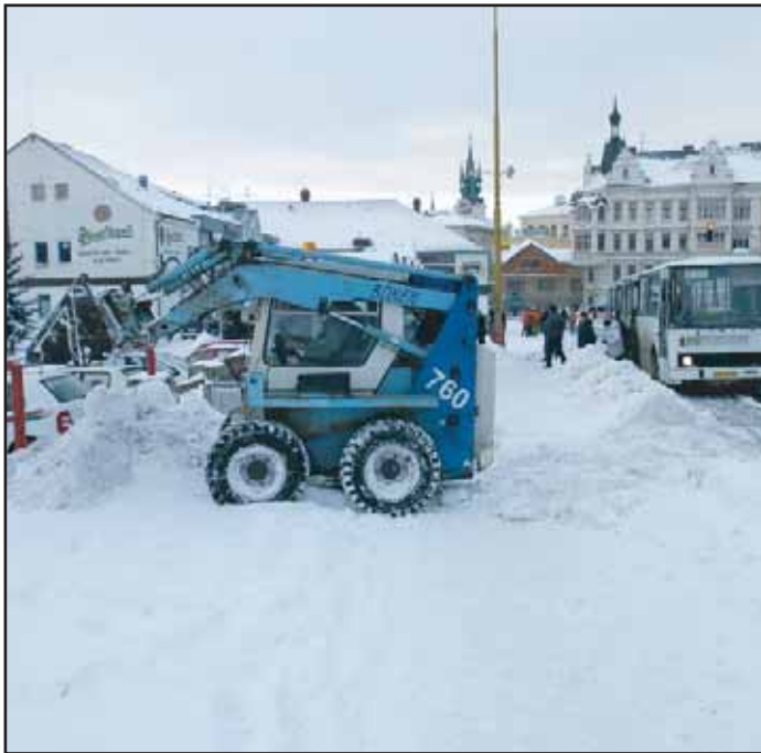
K odklizení únorové sněhové kalamity byly použity všechny dostupné mechanizační prostředky.