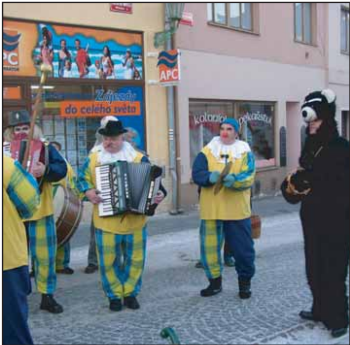
V masopustním průvodu, který připravili členové SDH Bohutín, vládla spokojenost a dobrá nálada.