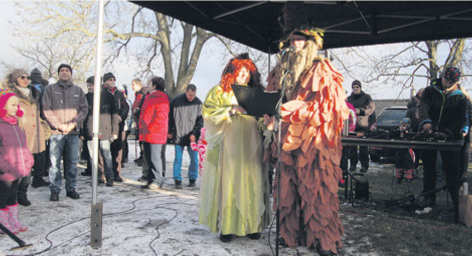
Setkání s Fabiánem, vládcem a pánem brdských lesů, a lesní žínkou Brdonkou.