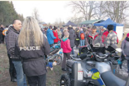
Policie ČR předvedla novou techniku určenou na udržování pořádku v Brdech.