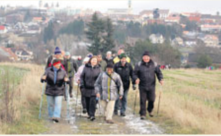
Klub českých turistů do Orlova vyrazil pěšky z Březových Hor.