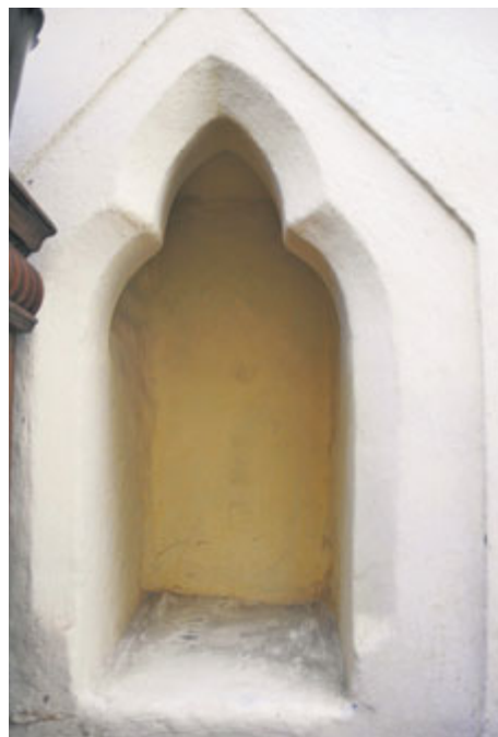
Nika z kostela sv. Jakuba, kolem roku 1300

Na konci třináctého století, kdy po nájezdech loupeživých band nezbylo z Příbrami skoro nic, přišel čas na renesanci „místa řečeného Příbram“ a okolních vsí.