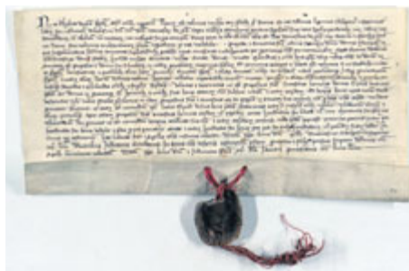
Listina Tobiáše z Bechyně z roku 1287

Druhou osobností našeho jubilejního roku, kterou si představíme v historické rubrice Kahanu, je pražský biskup Tobiáš z Bechyně (datum narození není známo, zemřel v roce 1296). Dozvíme se také první doložené jméno obyvatele Příbrami.