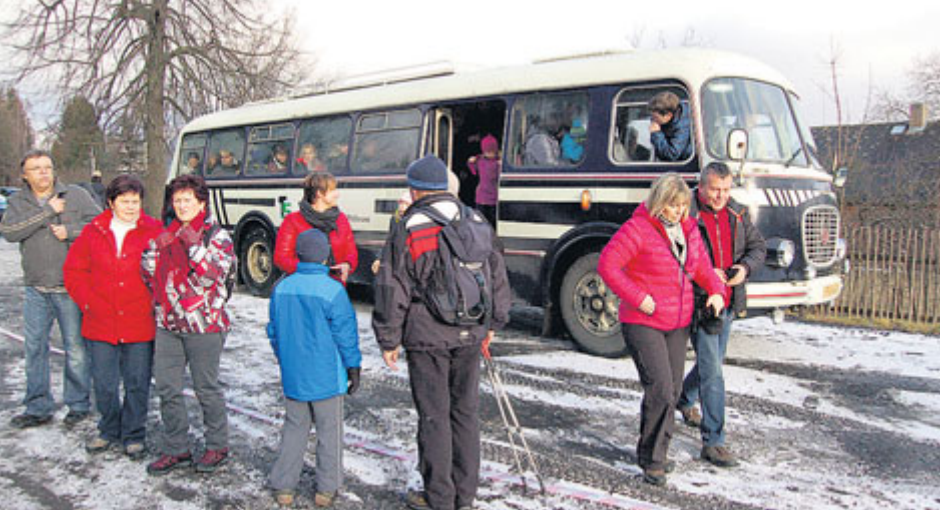
Historický autobus Technických služeb města Příbram.