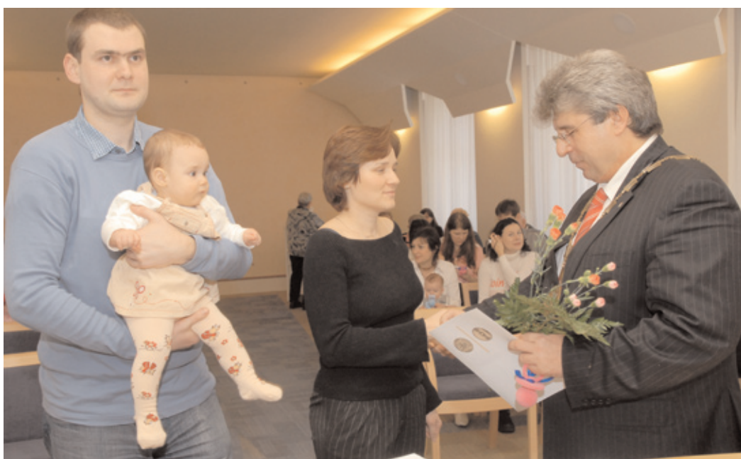
Tradiční vítání občánků proběhlo v Zámečku - Ernestinu v poslední lednový čtvrtek.