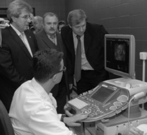
Město přispělo nemocnici na nový 3D ultrazvuk.

Finanční prostředky, které jdou z rozpočtu města příbramským školám a školským zařízením, jsou v letošním roce rozdělovány podle zcela nových kritérií. Hlavním cílem bylo, aby školy dostávaly finanční prostředky, které budou plně odpovídat realitě – počet žáků, plocha vnitřních prostor, určitá část se odvíjí i od potřeby údržby venkovních ploch. Příkladem může být Základní škola pod Svatou Horou, která má na starosti poměrně velké zelené plochy, které k této škole patří, na rozdíl třeba od ZŠ Jiráskovy sady. Tento model je objektivní a ztotožnili se s ním i ředitelé škol a školských zařízení.