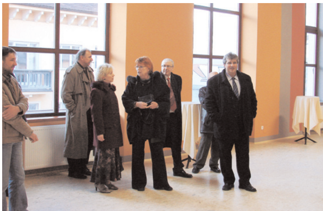
V příbramské Sokolovně vznikl po rekonstrukci krásný gymnastický sál.