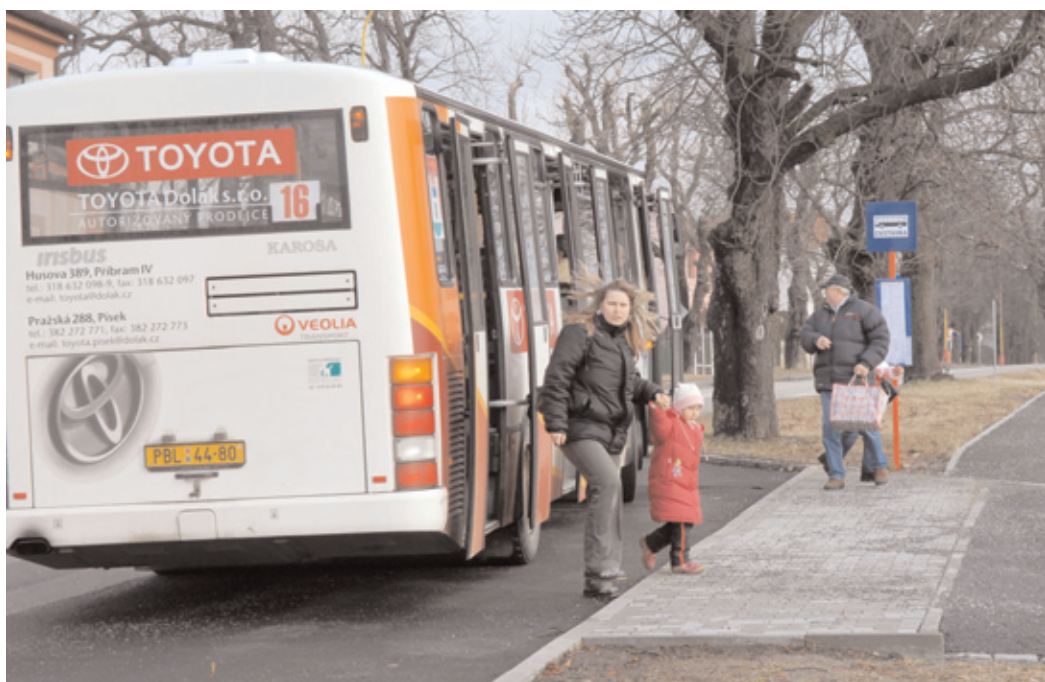
V Žižkově ulici proti stadionu SK Spartak byla uvedena do provozu nová zastávka MHD.