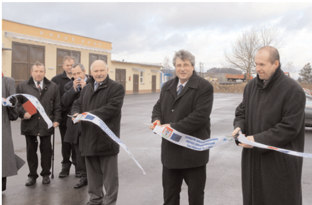
Zrekonstruovaná čistírna odpadních vod byla slavnostně uvedena do provozu 18. 1. 2008.