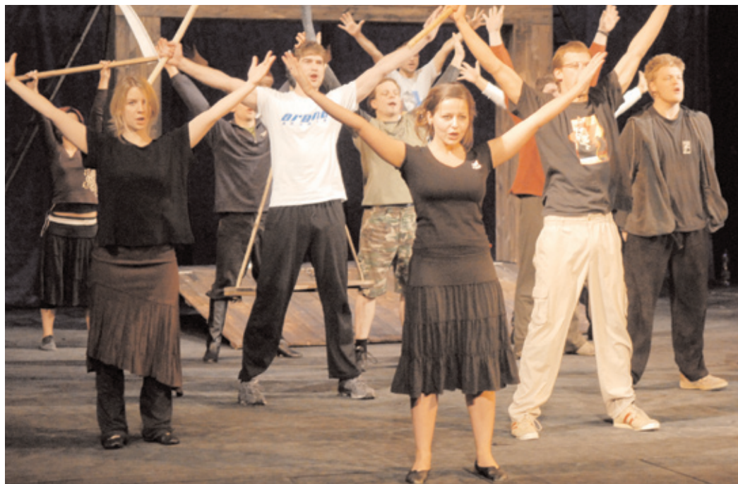
Herecký soubor Divadla A. Dvořáka se připravuje na únorovou premiéru hry "Malované na skle".