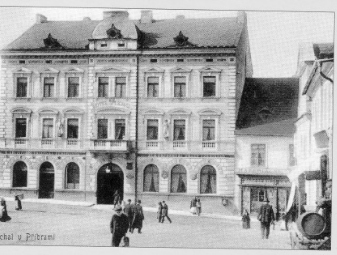
chel u Příbrami