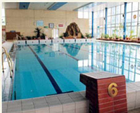
Tématem č. 1 je aquapark.

Na co by se měla Příbram zaměřit v roce 2023? To byla otázka, kterou redakce Kahanu položila všem sedmi „zastupitelským klubům“, které zasedají v příbramském zastupitelstvu. Přinášíme pohledy těch volebních stran, které odpověděly.