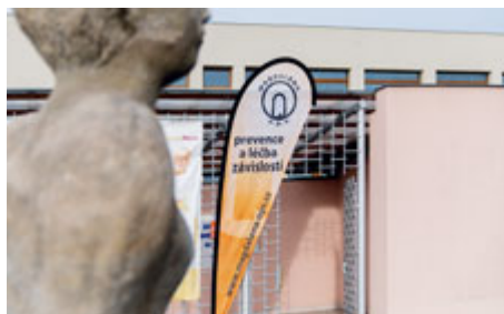
Magdaléna sídlí v bývalém školním areálu v Žežické ulici.

Dvě desetiletí pomáhá obecně prospěšná společnost Magdaléna v Příbrami a okolí. Centrum adiktologických služeb (CAS) provozuje adiktologickou ambulanci, kontaktní centrum a terénní služby pro závislé nebo pro jejich rodiny a blízké. Zapojeno je i do projektu ve Věznici Příbram. Centrum primární prevence Magdaléna působí na příbramských školách i v okolních obcích. Za dvacet let prošly našimi službami tisíce dětí, dospívajících či dospělých lidí z Příbrami a okolí.