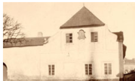
Hostinec U Heroltů, vpravo jsou vidět ze zahrady báňského ředitelství a synagoga.

Od 11. ledna 1850 se v Jaroškově hostinci scházela osvětová Měšťanská beseda. Po Prokopovi