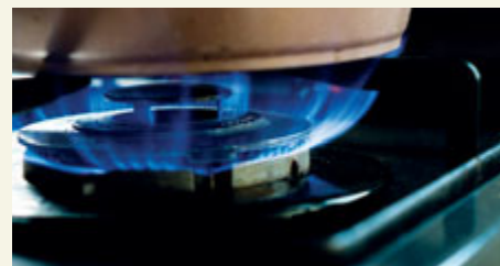
Energie jsou dalším důležitým tématem.

Z delty pomalu končícího roku pomalu vplouváme na moře roku nového. Životy všech cestujících a námořníků na pomyslném parníku Příbram tíží inflace, energetická krize, situace nízkopříjmových domácností i rozdělení společnosti, na kterém se velkou měrou podílejí algoritmy sociálních sítí. Hodně pasažérů se reálně nachází v rozpoložení, pro které Václav Havel přišel s označením blbá nálada, a ještě dříve s konstatováním, že naše země nevzkvátá. Nevzkvátá ani naše město. Příbram se pomalu, ale jistě vyvíjí, její vedení neumí dotahovat velké investiční projekty, v každoročním žebříčku kvality života ve dvou stovkách českých měst se pohybujeme na chvostu pelotonu.