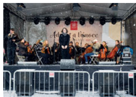
■ Fotografie: Městské kulturní centrum, SZM Příbram Text: Stanislav D. Břeň