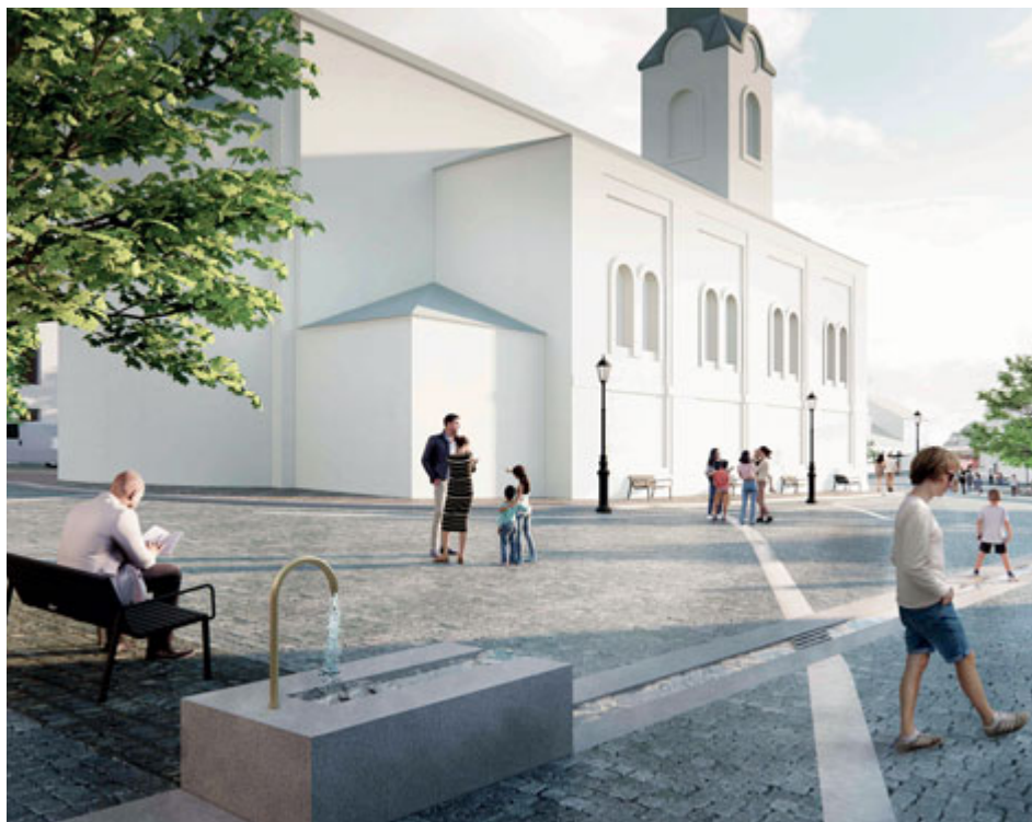
Někdejší hlavní Vojtěšská žíla se na povrch náměstí propisuje formou strouhy, která kolem sebe soustřeďuje vodní prvky. Oživuje náměstí a slouží jako odvod dešťové vody do akumulací nádrže.

cování porota doporučuje koncepci stromové zeleně tak, aby jednoznačněji vymezila prostor obou náměstí a potvrdila jejich propojení.