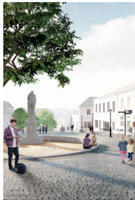
Lavice kolem sochy sv. Jana Nepomuckého postupně navazuje na úroveň náměstí, umožňuje tak přístup k pítce, soše i lípě. Zároveň vymezuje plochu mlatu, která významně pomáhá vsakování vody, a přispívá tak lepším vegetačním podmínkám pro památnou lípu.