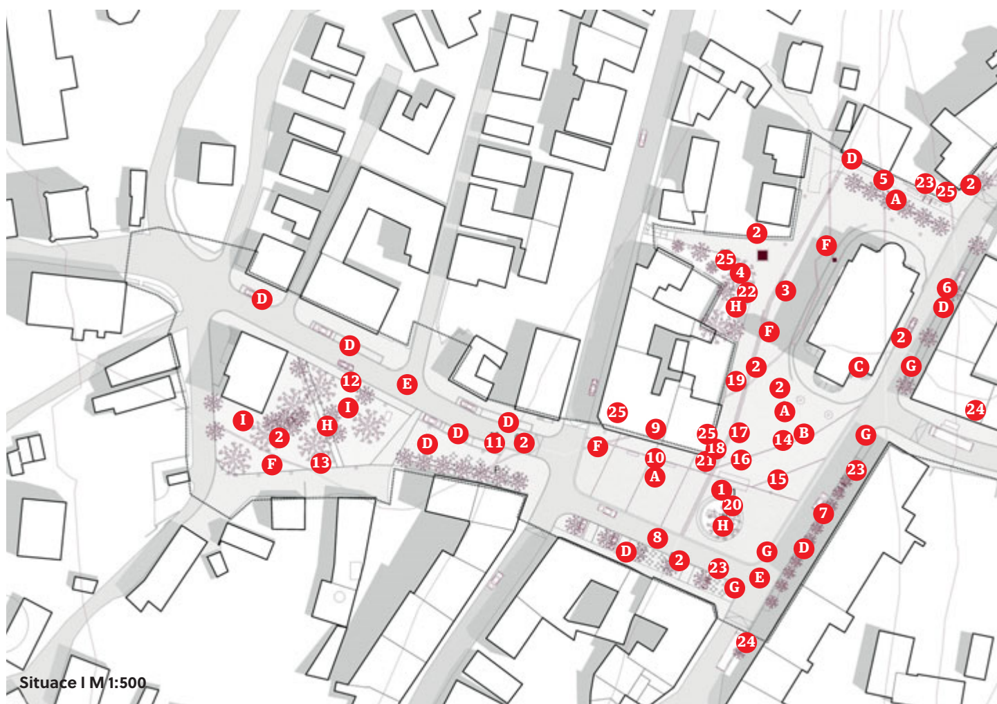
Situace | M/1:500