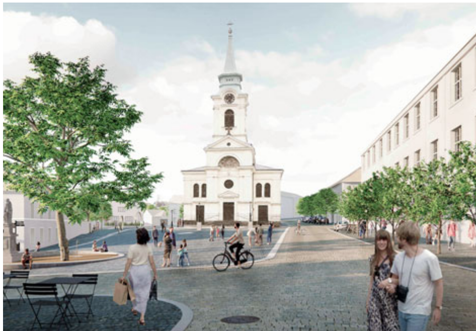
Návrh zpřehledňuje dopravní situaci a zlepšuje orientaci na náměstí. Jsou zde vymezené zóny pro dopravu, volná prostranství, místa pro kulturu a trhy, předzahrádky kaváren i posezení ve stínu stromů.

Po podzimním představení vítězného návrhu architektonické soutěže, která řeší podobu náměstí J. A. Alise na Březových Horách, se mezi odborníky i laickou veřejností rozpoutala debata, nakolik bude návrh přínosem pro náměstí samotné, obyvatele i návštěvníky Březových Hor a jaké prvky či navržená řešení jsou vhodné či které by stály za změnu. Kahan přispívá k této veřejné debatě prezentací vítězného návrhu studia monom works.