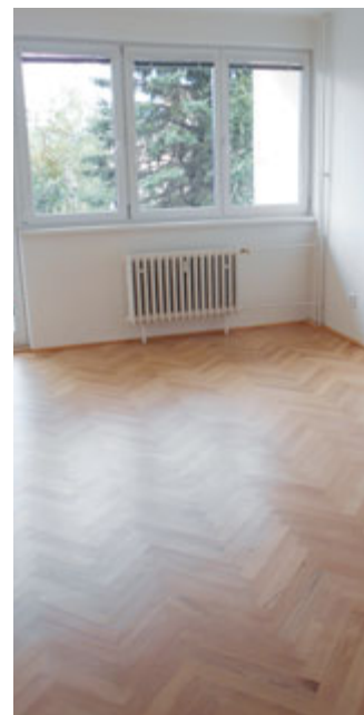
Jednou z náročných investic byla celková rekonstrukce budovy čp. 69 v Hradební ulici (DPS) včetně všech bytů. Fotografie dokumentují stav před rekonstrukcí a po ní. Všechny byty byly zrekonstruovány stejně.

Stavebně technický stav bytového i nebytového fondu není vždy utěšující. Údržba bytového fondu v minulosti nebyla dostačující. Nízká úroveň nájemného se stala problémem pro tvorbu zisku z bytového fondu. V současné době vynakládá město Příbram do oprav, údržby a na rekonstrukce vysoké náklady. Kromě prováděných drobných oprav a údržby v bytech, jako jsou např. výměny kuchyňských linek, opravy obkladů, dlažeb, výměna zařizovacích předmětů - sporáků, baterií či dveří, se vždy po uvolnění bytu snažíme celý byt zre-