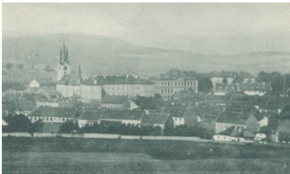
Ve střední části fotografie je patrná proluka za novou radnici, foceno asi v roce 1899.