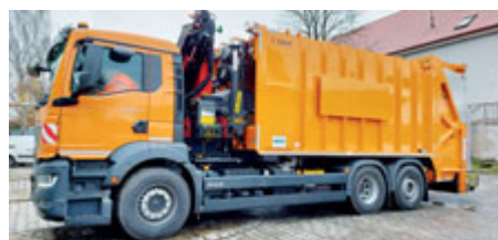
Nový svozový vůz stál město 8,5 milionu korun.

Polozapuštěné kontejnery budou postupně instalovány i v dalších lokalitách města, ideálně při rekonstrukcích ulic a vnitrobloků. Nově se jich