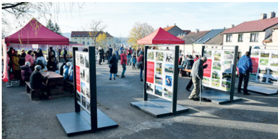
Z listopadové prezentace renovovaných sadů v Hrabákově ulici.

Revitalizace svatohorských sadů ukazuje, jak může spolupráce mezi různými organizacemi vést k úspěšnému výsledku. Obnovu sadů bylo možné realizovat díky společné investici několika partnerů zapojených do tohoto projektu. Spolek Svatohorské sady se postaral o vykácení keřů a náletových nebo nevhodně vysazených neovocných stromů a výsev trávníků. Příbram financovala vybudování altánu, pořízení mobiliáře a úklid prořezaného materiálu. Město a farnost budou společně sekat cesty v trávě a jednou ročně celou lokalitu, aby nedošlo k zarůstání nálety. Komunitní projekt by nebylo možné realizovat bez významného partnera, společnosti Billa.