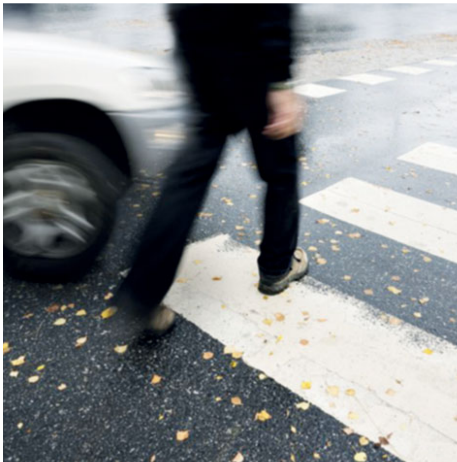
Chodci se před vstupem na vozovku musí přesvědčit, jestli ji mohou bezpečně přejít.

Během několika podzimních týdnů byla v Příbrami sražena desítka chodců, kteří přecházeli přechod pro chodce. Jak se ukazuje, značná část účastníků silničního provozu nezná své povinnosti.