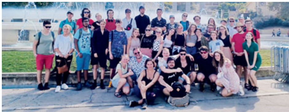
Kromě uměleckého čekal na účastníky také turistický program.

Začátkem října se naše ZUŠ Antonína Dvořáka zúčastnila mezinárodního hudebního a tanečního festivalu v Malgrat de Mar ve Španělsku. Na pětidenní akci vystupovaly školní kapely Evakuace, Ladies and Gentlemen a náš školní dechový orchestr, který byl doplněn o žáky ze ZUŠ J. J. Ryby Rožmitál pod Třemšínem a ZUŠ Břežnice. Na celém festivalu se předvedlo několik souborů z celého světa.