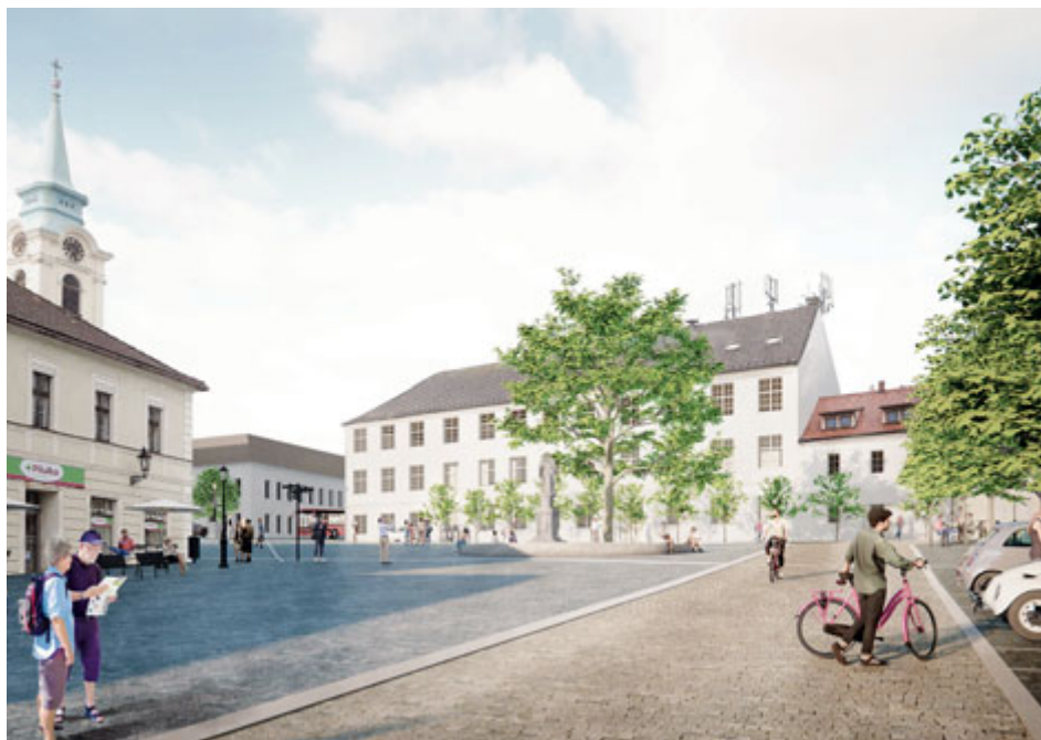
Předprostor sochy sv. Jana Nepomuckého je navržen jako klidná volná plocha, která nechává vyniknout dominantám sochy a lípy.