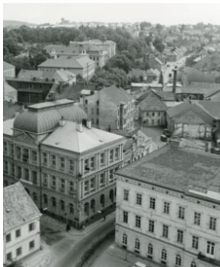
Pohled z věže kostela sv. Jakuba staršího na současném náměstí T. G. Masaryka. V popředí vpravo budova někdejšího báňského ředitelství, vlevo radnice a za ní v ulici Hailova budova spořitelny.

Dne 29. října 2022 se v příbramské Hailově ulici zřítla část domu č. p. 187/I, který přiléhá k budově radnice z roku 1893. Podívejme se na jeho historii.