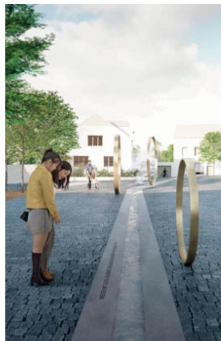
Hladké linie, které značí podzemní štoly, jsou na několika místech opatřeny krátkým textem vytesaným do kamene s informacemi o jejich historii, technických náležitostech a jiných zajímavostech, a stávají se tak další vrstvou přeměny náměstí.

Porota ocenila kultivovaný názor i prezentaci budoucí podoby náměstí J. A. Alise a náměstí Hynka Kličky. Návrh přináší jasný názor na organizaci řešeného prostoru, respektující historii místa a odkazující se na ni. Návrh propojuje obě náměstí do jednoho celku; k případnému dopra-