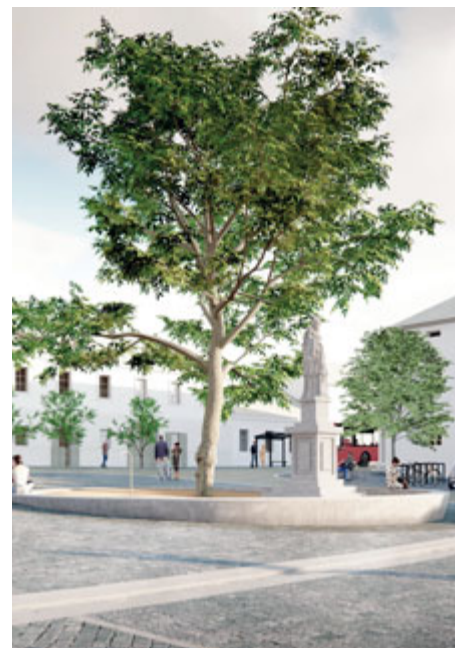
Namísto sloupků s řetězy je kolem sochy sv. Jana Nepomuckého umístěna kruhová lavice, která sochu i lípu chrání a zároveň také umožňuje stíněné posezení v centru náměstí.

Rekonstrukce náměstí se připravuje již dlouho a architektonická soutěž je důležitým, přesto dílčím prvkem celého procesu. K rekonstrukci náměstí se od počátku mohla vyjadřovat veřej-