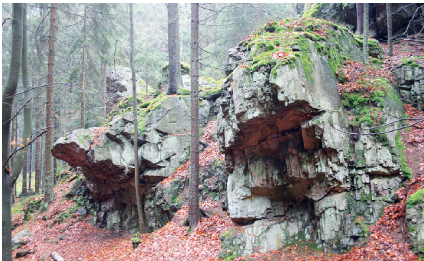
Čertovo vřeteno, část s převisem.

Na severních svazích vrcholu Kobylí hlava (757 m), kde se nachází pozůstatky tvrziště Hengst, ve vzrostlém lese nedaleko cesty od Hutí pod Třemšínem směrem k boudě Roubenka se k nebi vypíná divoké a rozeklané skalisko, odedávna zvané Čertovo vřeteno. S velkou dávkou představivosti opravdu svým tvarem tkalcovské vřeteno připomíná.