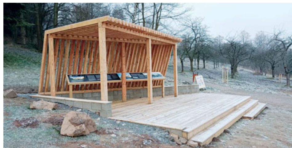
Na okraji sadů byl zbudován také nový turistický altán.

Stejně se postupuje i ve spodní části sadu kolem ulice Na Leštině, i když celá tato oblast není přeměněna v ovocný sad. Část současného parku zůstává ve stávající podobě. Obnova sadů je navržena především kolem centrální historické pěší osy směřující ke Svaté Hoře. Podél této linie jsou vysazeny tři řady ovocných stromů.