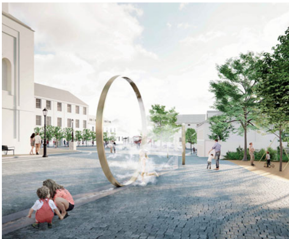
Vodní prvky volně interpretují důlní kola a struhy, které přiváděly vodu z hor jako zdroj energie k čerpání vody z místních dolů. Kola mají nejen estetickou a edukativní hodnotu, ale zároveň fungují jako mlhoviště nebo fontána pro zpříjemnění horkých letních dnů. V neposlední řadě poslouží dětem (i dospělým) jako netradiční osvěžující prolézačka.