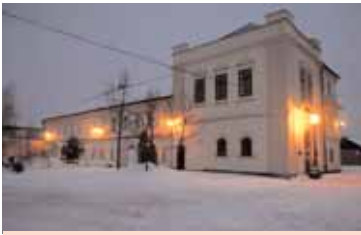
Romantický večerní snímek ze zasněžených Březových Hor.