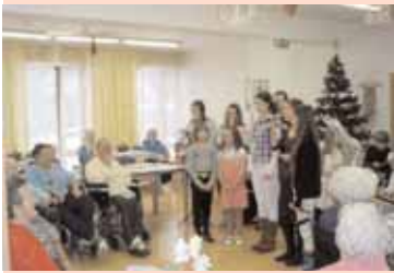
Pečovatelská služba města Příbram jako každým rokem připravila pro své klienty vánoční setkání.