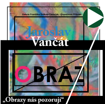
„Obrazy nás pozorují“

Podmínky výběrového řízení: 1) 1. výběrové řízení podaných žádostí proběhne dne 7. 2. 2011 , 2) lhůta pro podávání žádostí je stanovena do dne 31. 1. 2011 , 3) obsah žádosti musí splňovat podmínky uvedené ve vyhl. města Příbram č. 2/2008, čl. 5, odst. 3, 4) žádosti se podávají na formuláři, který je k dispozici na Městském úřadu Příbram, ekonomickém odboru, a na internetových stránkách města www.pribram.eu .