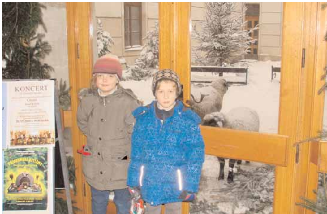
Město Příbram připravilo 15. 12. akci Vánoce v Záměcku. V tento den byl vstup do všech expozic zdarma. Studenti Waldorfské školy předváděli své kovářské a truhlářské výrobky, byly vystaveny marionety, návštěvníci si mohli koupit vánoční pečivo. Dětem se hlavně líbily dvě ovečky v átriu.