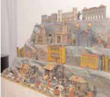
Hornické muzeum Příbram vystavovalo v Galerii F. Drtíkova v Zámečku - Ernestinu betlémy.