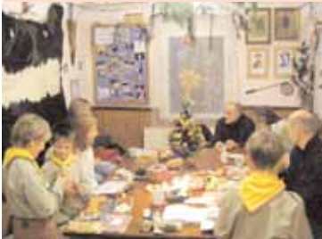
Vánoční kmenová nadílka skautského oddílu Mohawk přinesla opět radost a mnoho zážitků pro členy kmene a jejich rodiče.