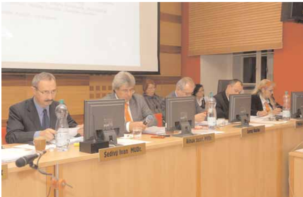
Druhé zasedání Zastupitelstva města Příbram se konalo v nově zrekonstruovaném sále v budově bývalého ředitelství RD Příbram na náměstí T. G. Masaryka 121.