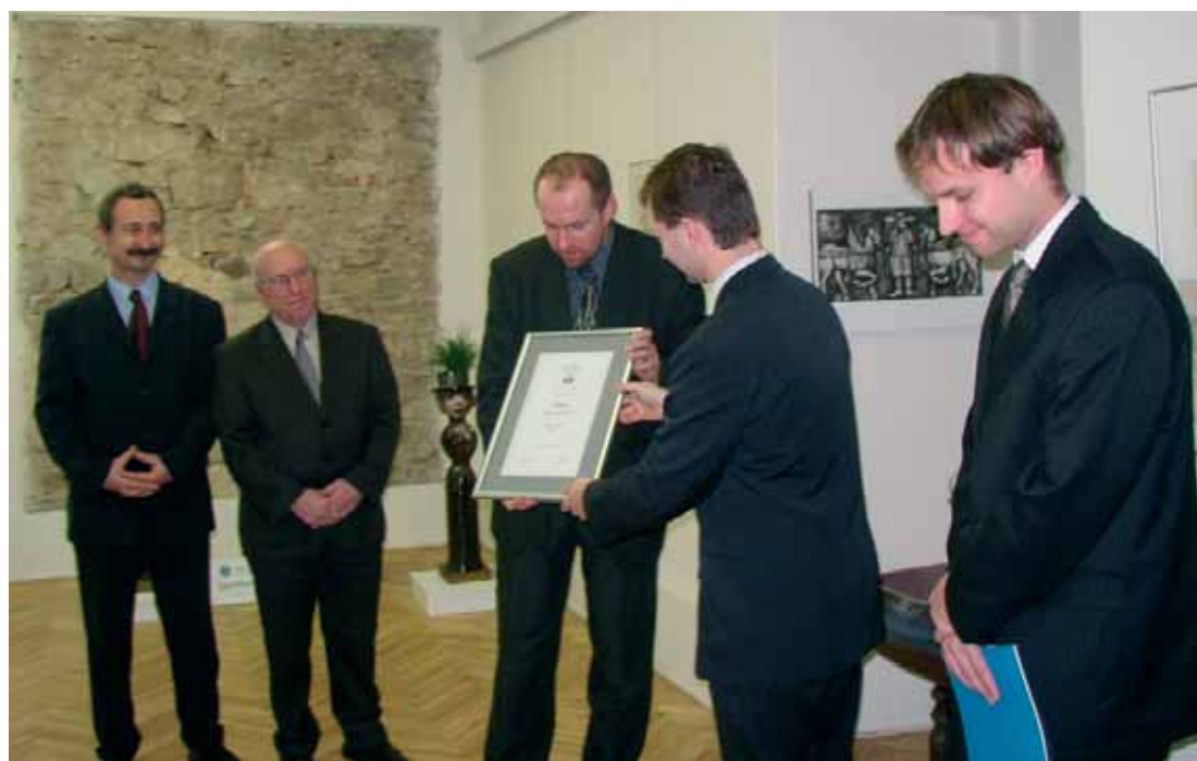
Dne 18. 12. 2003 převzali zástupci města od firmy CRA RATING Agency ratingovou analýzu města.