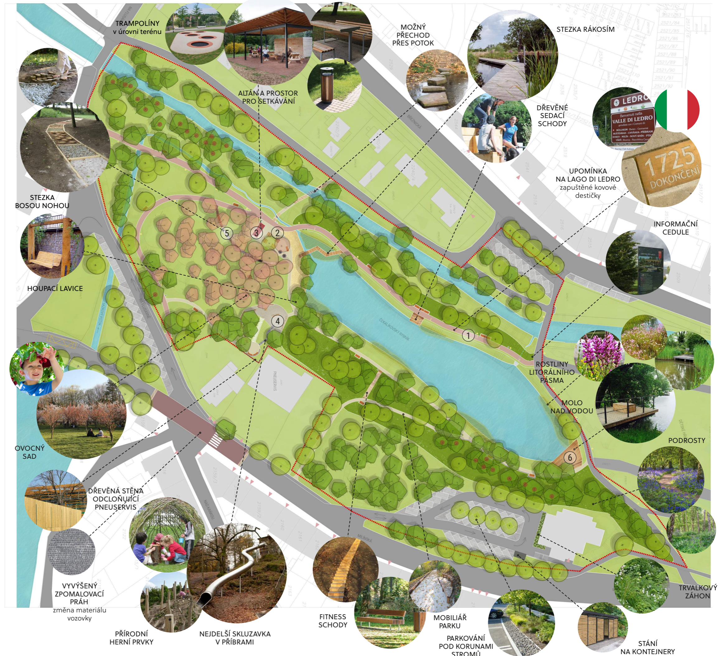
PŘÍRODNÍ HERNÍ PRVKY